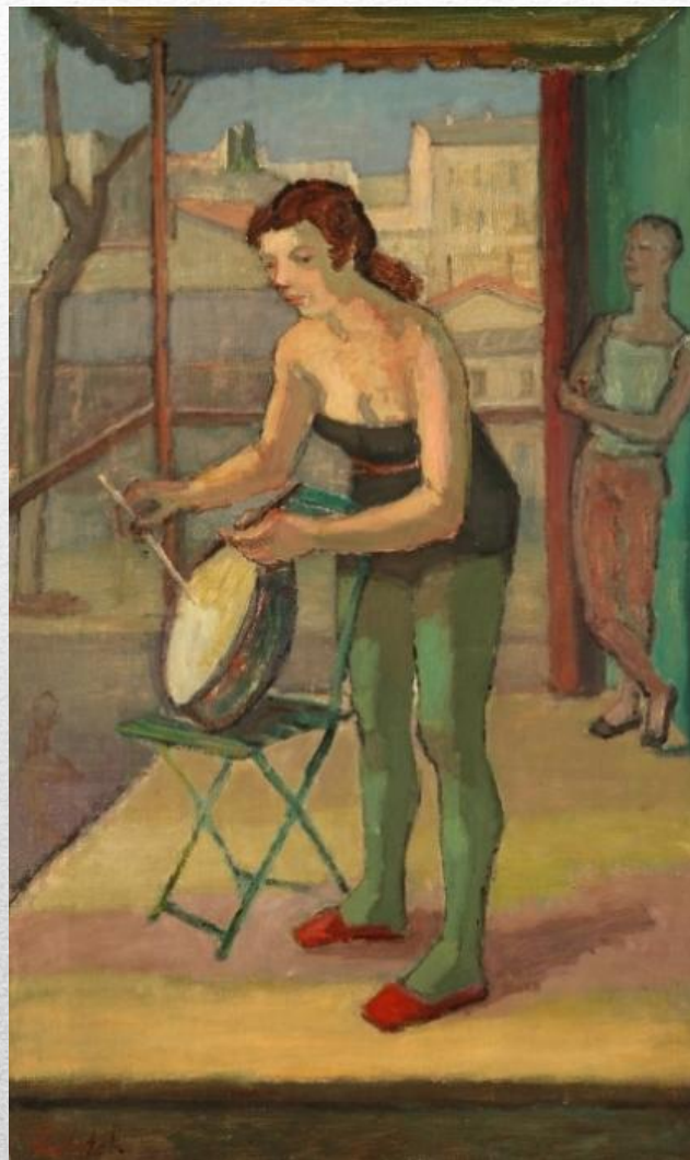
Восіп Любіч «Танцоўшчыца з тамбурынам»