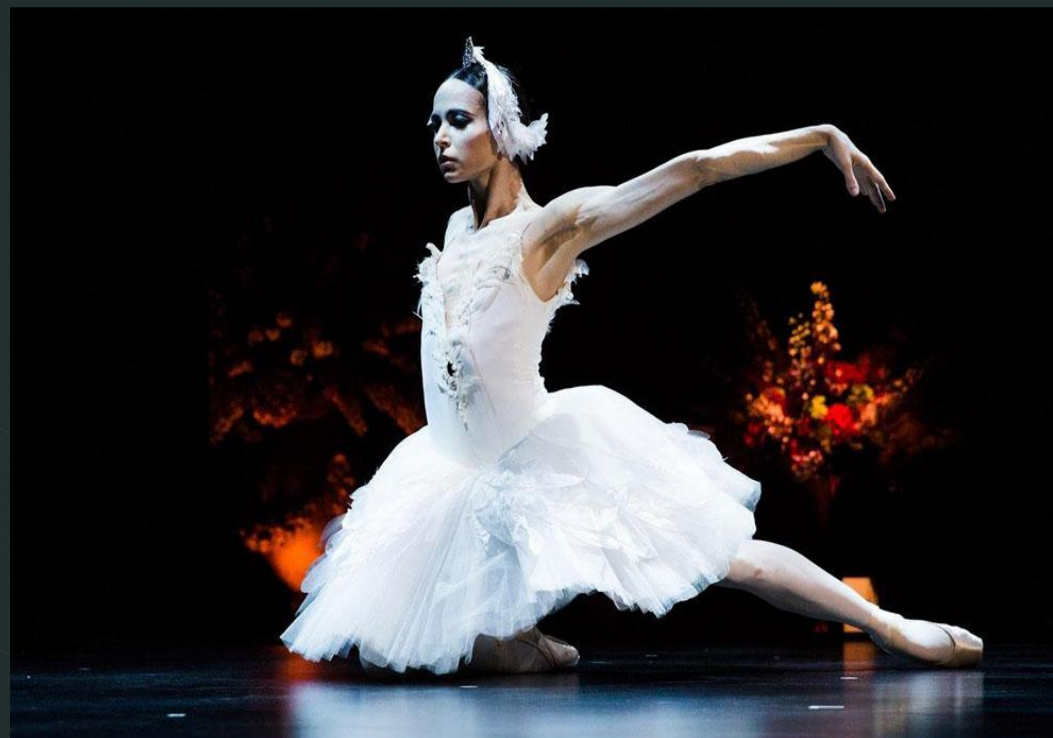
Диана Вишнёва Российская прима-балерина