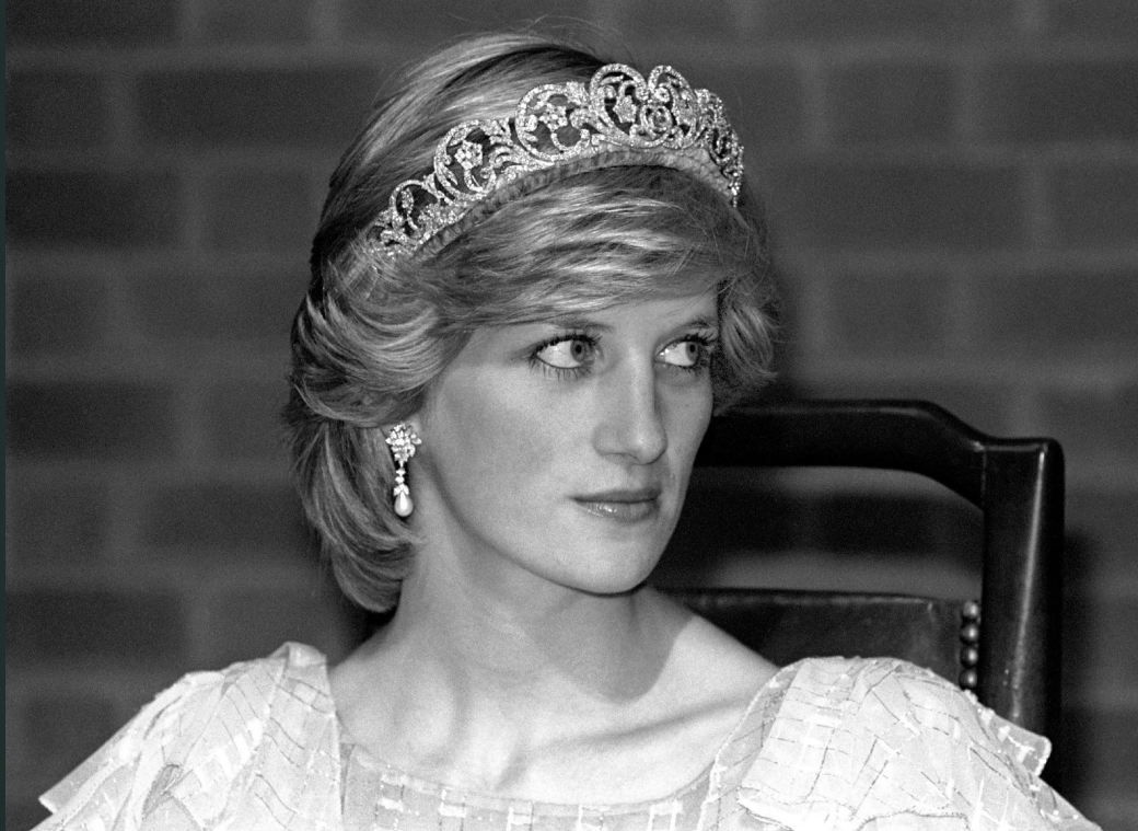
Диана Спенсер ( Леди Ди ) принцесса Уэльская