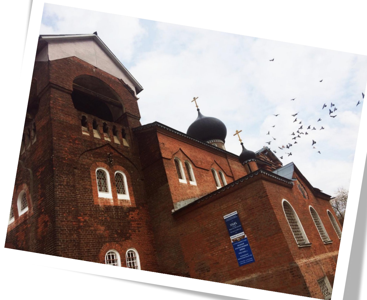
Храм Рождества Богородицы (РПСЦ) - поповцы, беспоповцы