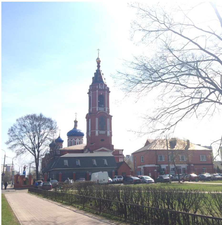
Собор Рождества Богородицы (РПСЦ)