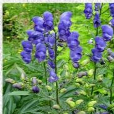
борец, он же аконит