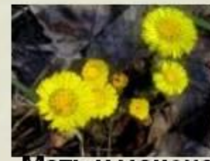
Мать и мачеха