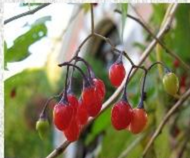
паслён сладко – горький