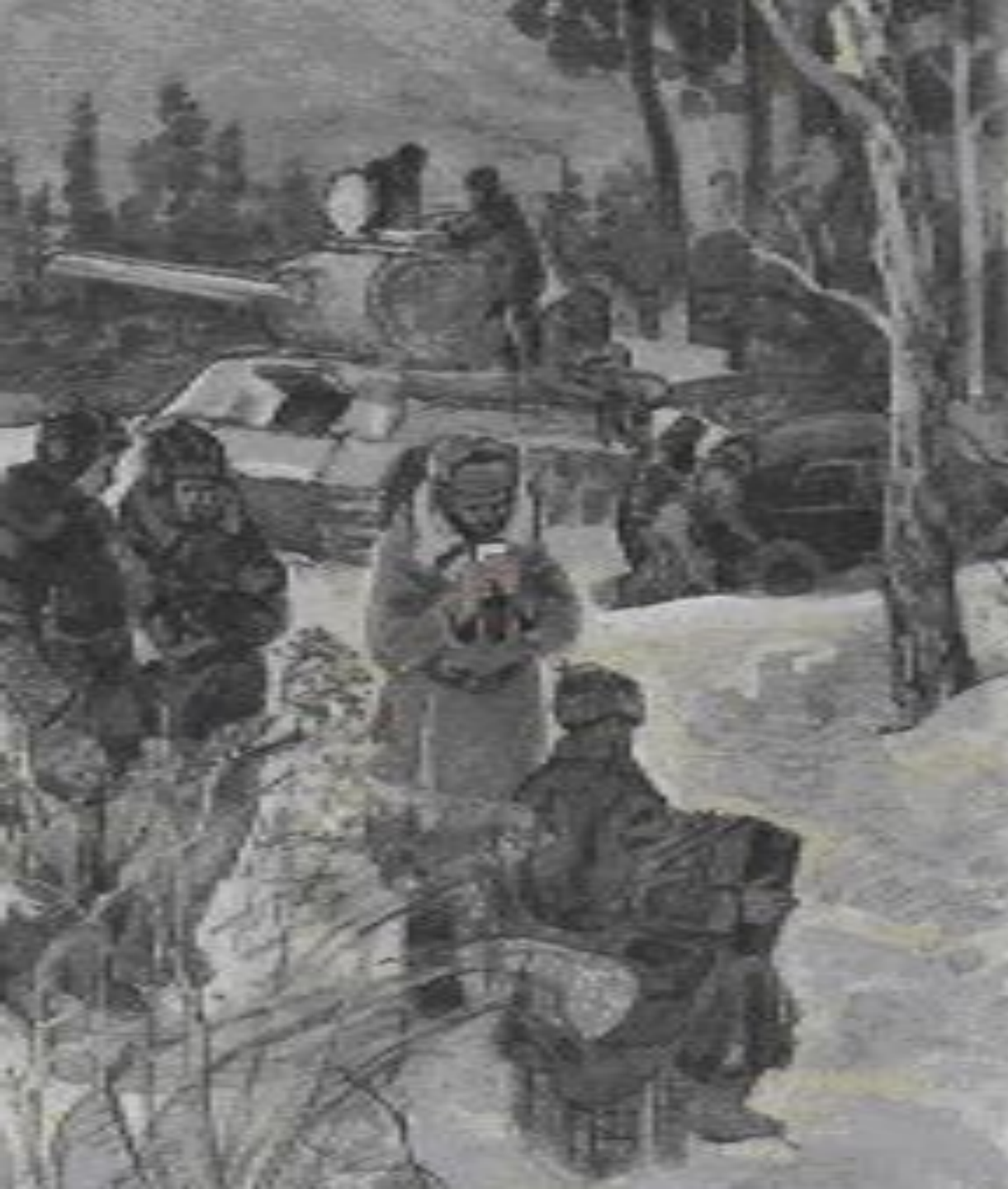
Иллюстрация к поэме «Василий Теркин». Глава «Гармонь».