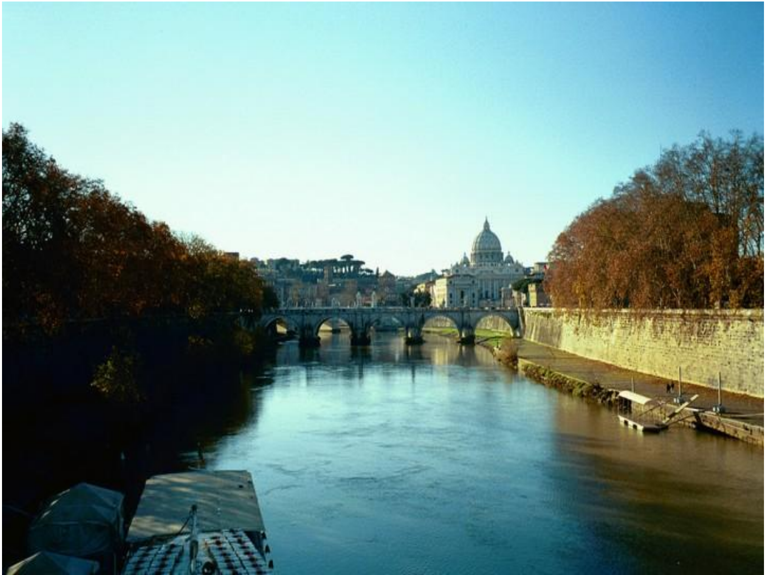
Il fiume Tevere