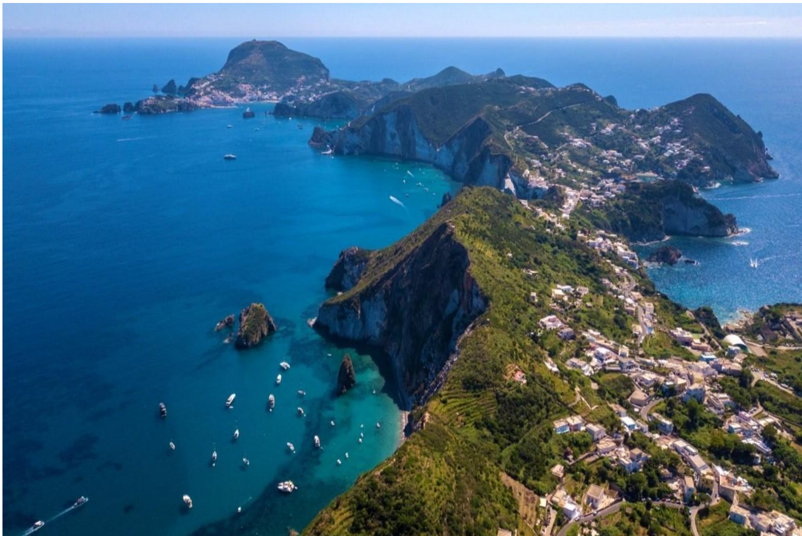
Le isole Ponziane (Pontine)