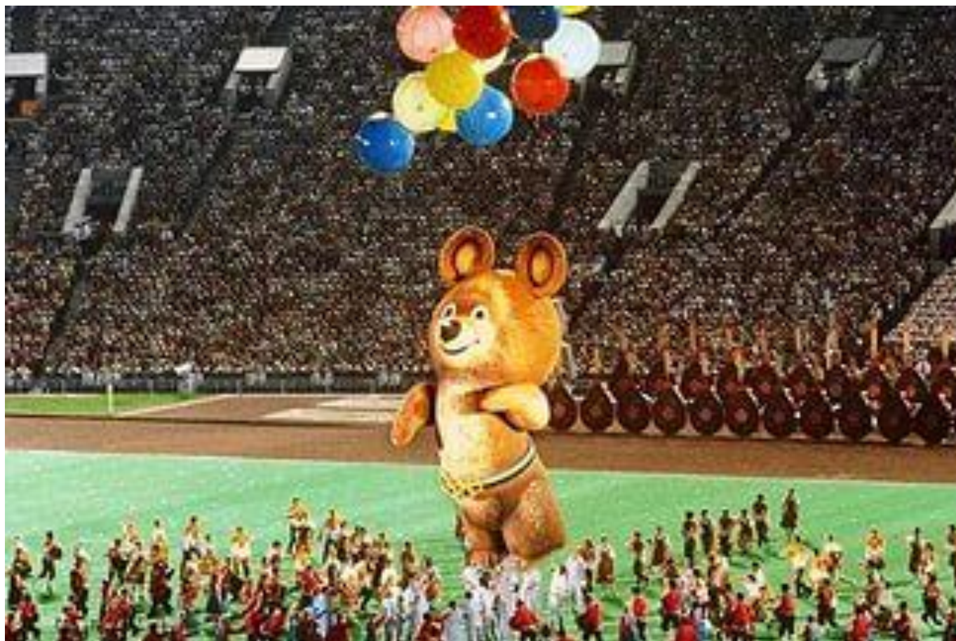
Олимпийские игры в СССР