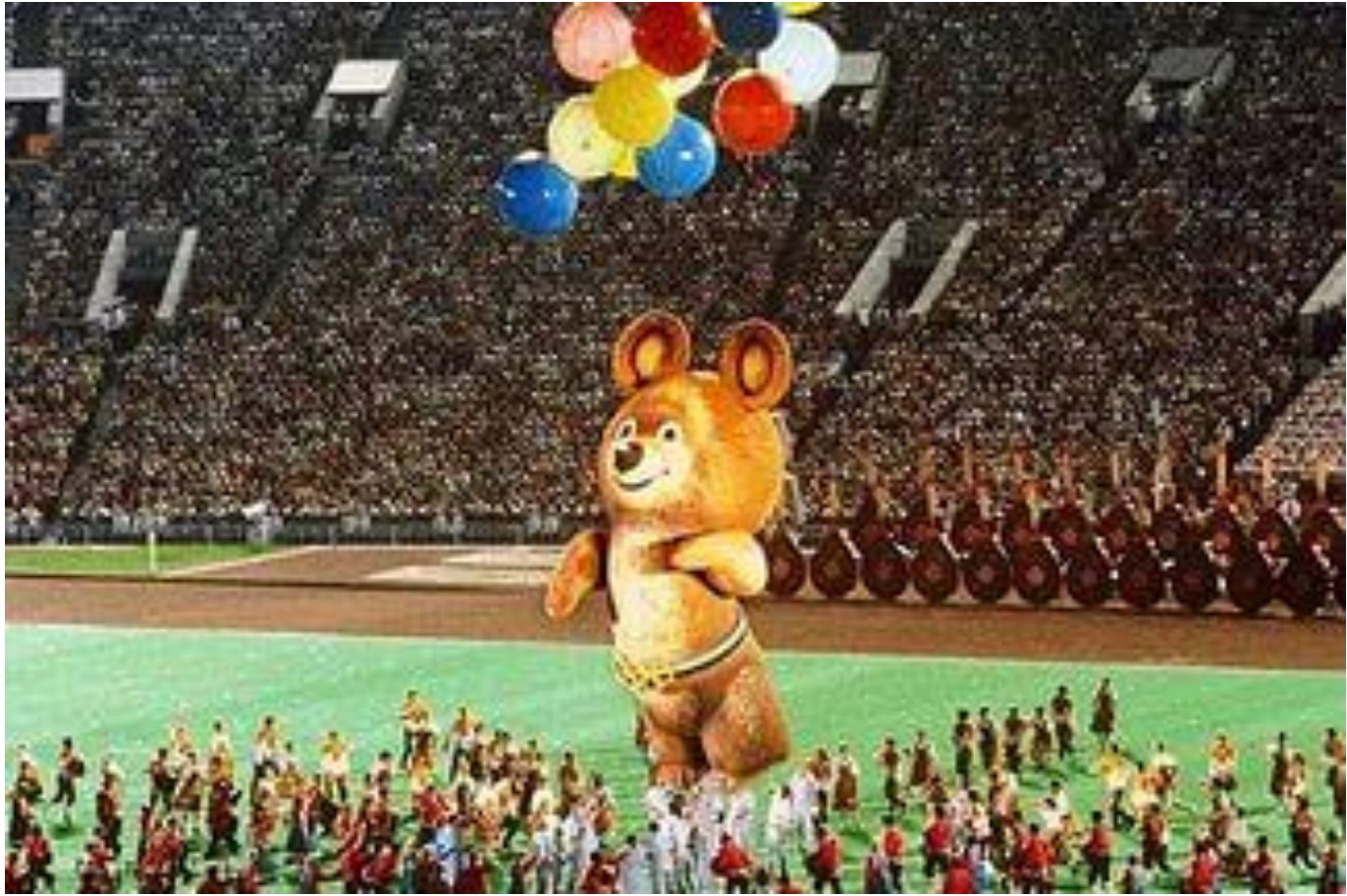
Олимпийские игры в СССР