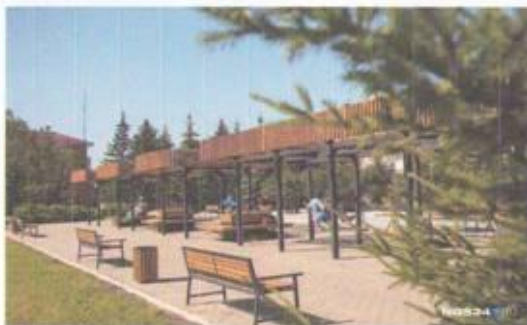
Енисейск Парк качелей