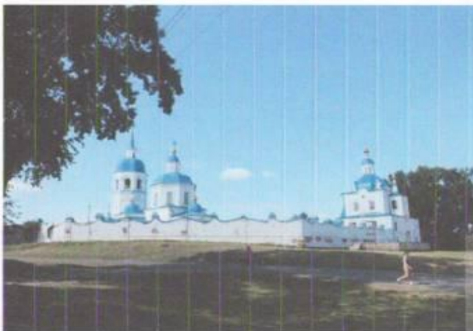
Енисейск Спасо-Преображенский мужской монастырь