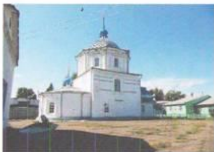
Иверский Енисейский женский монастырь