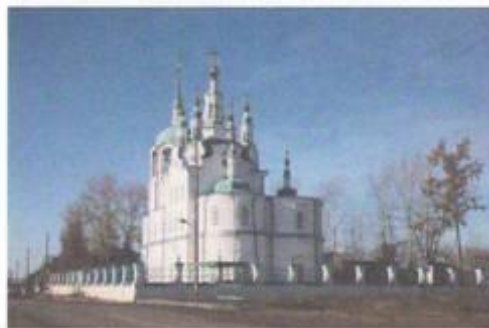
Собор Богоявления Господня

Первые упоминания о Богоявленской соборной церкви Енисейска относятся к 1647 г. Собор является одним из старейших и наиболее примечательных памятников сибирской церковной архитектуры. Восстановили Богоявленский собор в ходе реставрационных работ в преддверии 400-летия Енисейска: с 2016 по 2019 гг. После реставрации Собор стал настоящим украшением Енисейска.