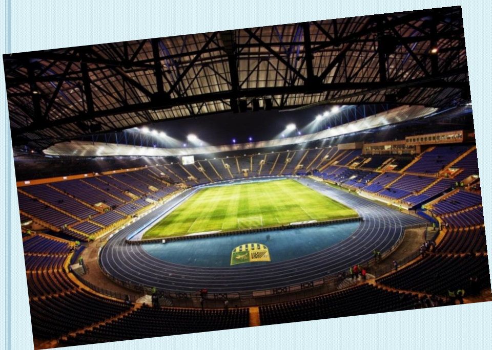
Харківський стадіон Металіст