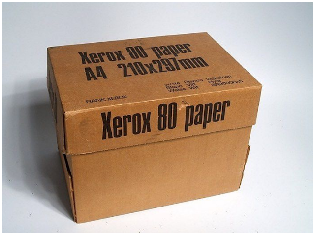
Коробка из-под ксерокса