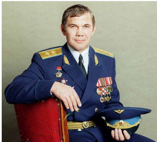
Голоса генерала А. Лебеда