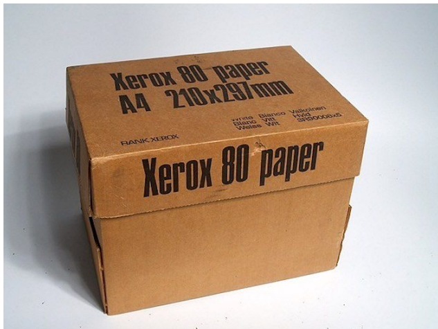
Коробка из-под ксерокса