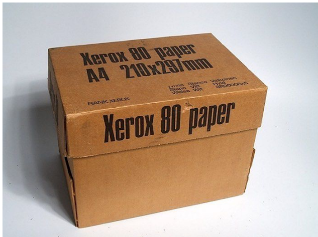
Коробка из-под ксерокса