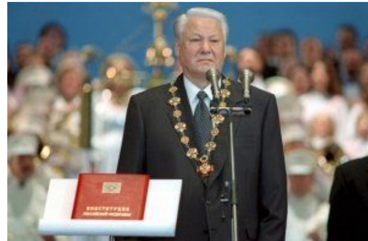
Победа Б.Н. Ельцина и его инаугурация