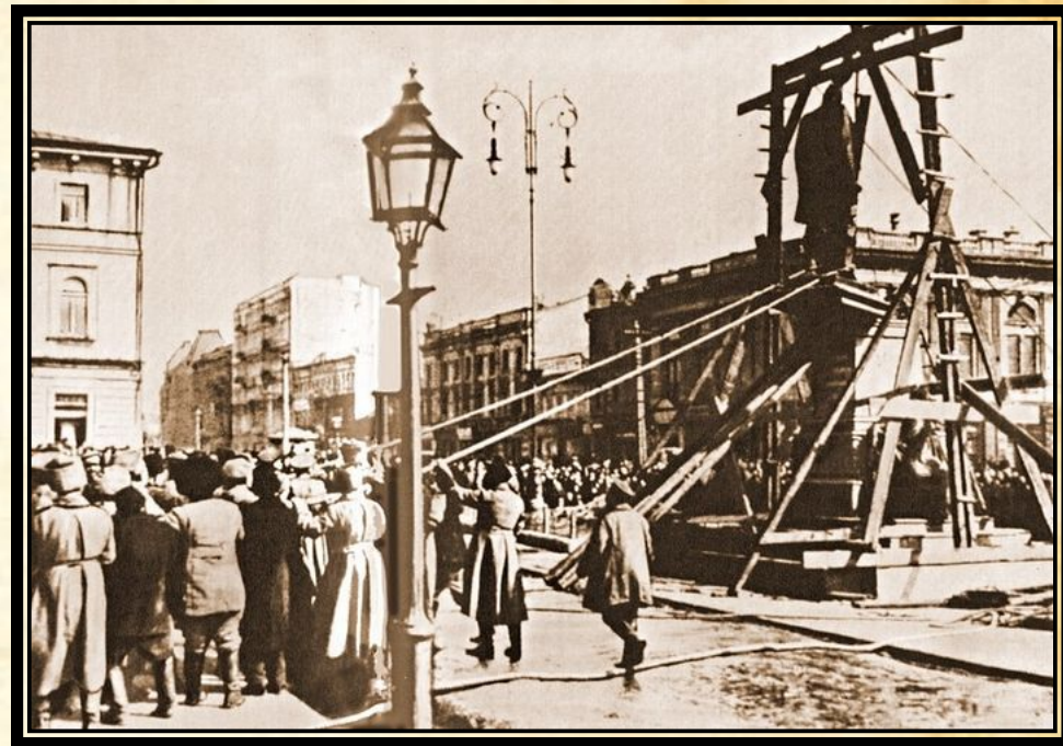
Свержение памятника Столыпину в Киеве, 15 марта 1917 года

Непосредственно об отделении от России и создании независимого государства стали широко говорить только к концу 1917 – началу 1918 годов. До этого речь шла преимущественно об автономии в пределах России. Но и для масштабной автономии, естественно, тоже нужна элита, группы влияния и управления. На роль таких групп влияния и претендовали – Грушевский, Винниченко, Петлюра. В идее широкой автономии они усматривали возможность повышения политического статуса, но даже после февраля 1917 года Украина ещё не претендовала на полную независимость, и само слово «Украина» произносилось редко.