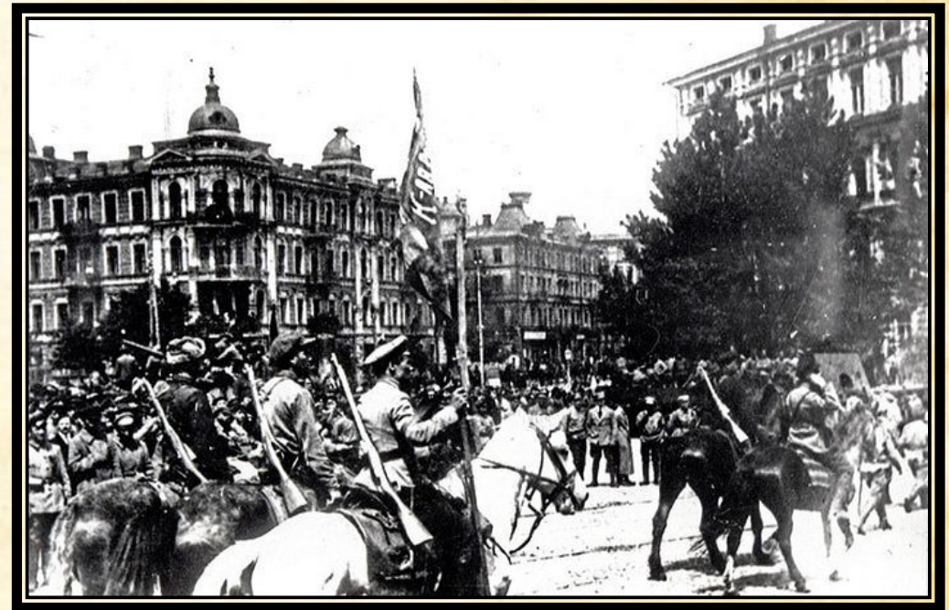
Красная армия после вступления в Киев, лето 1920 года.

События завершились установлением советской власти и образованием Украинской ССР на большей части территории современной Украины (кроме Западной Украины, территория которой была разделена между Польшей, Чехословакией и Румынией, а также Буджака, аннексированного Румынией в начале 1918 года).