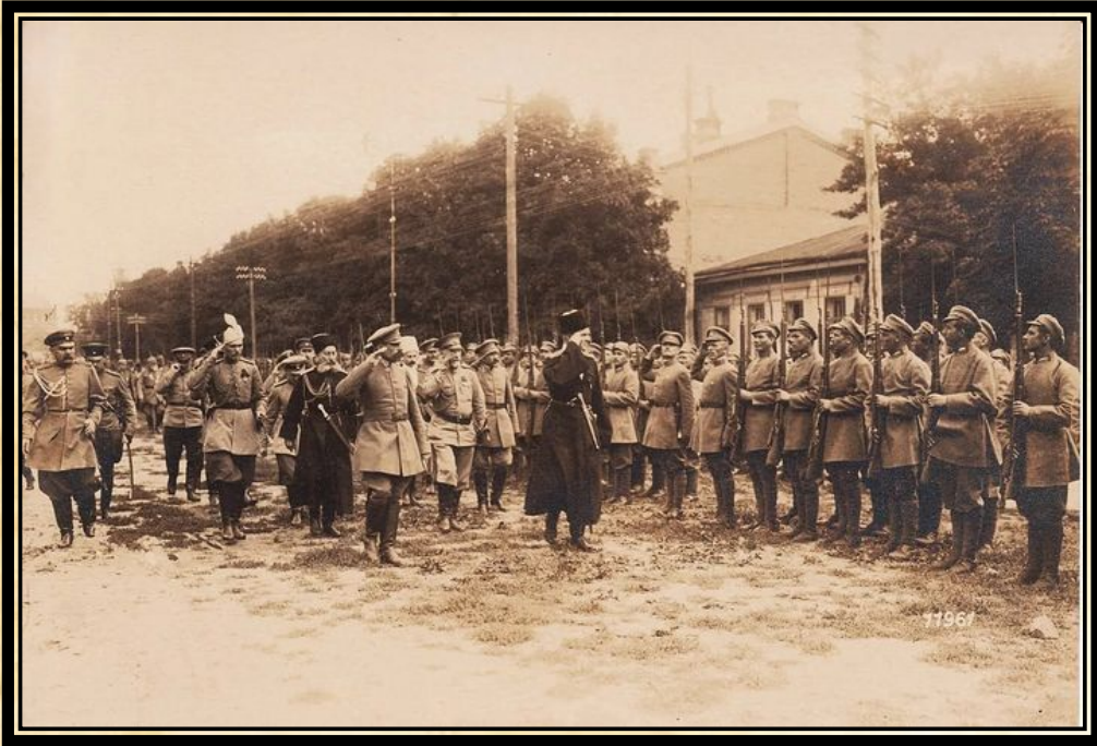
Армия гетмана П. Скоропадского