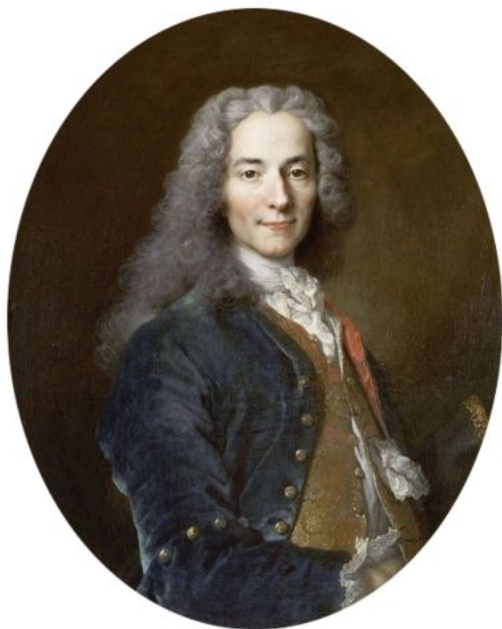
Вольтер ( Мари Аруэ )