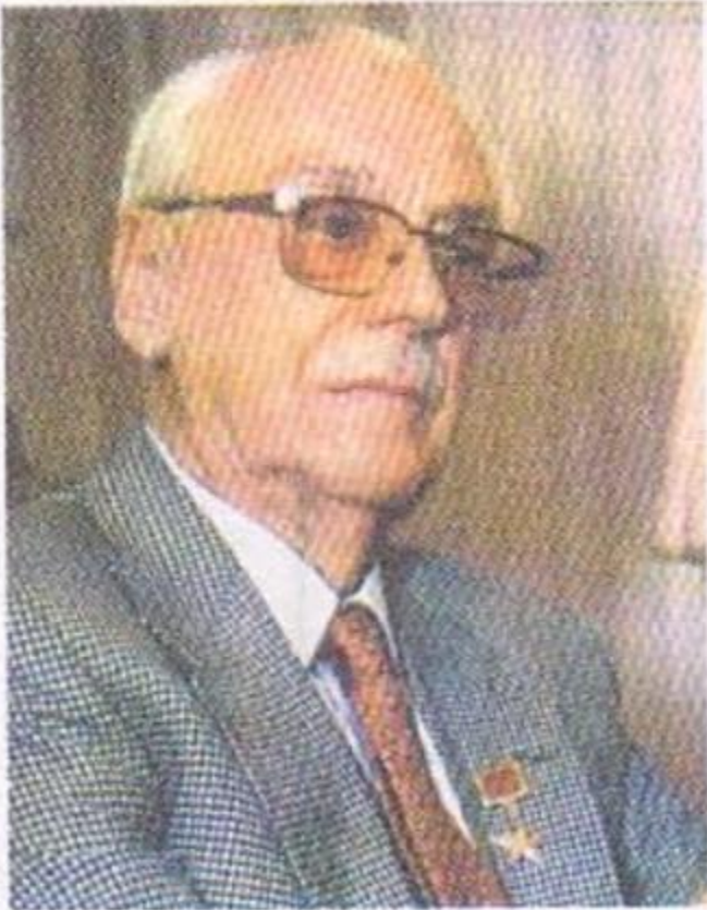
С. В. Михалков