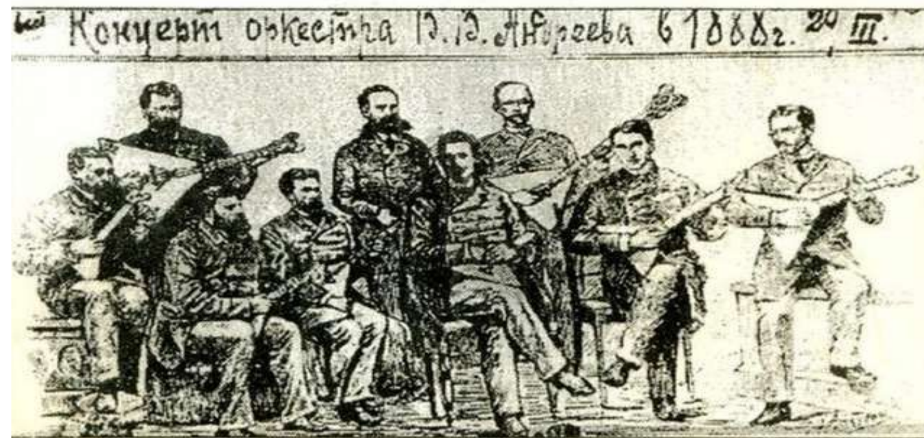
Кружок балалаечников под управлением В.В. Андреева. 1888 г.