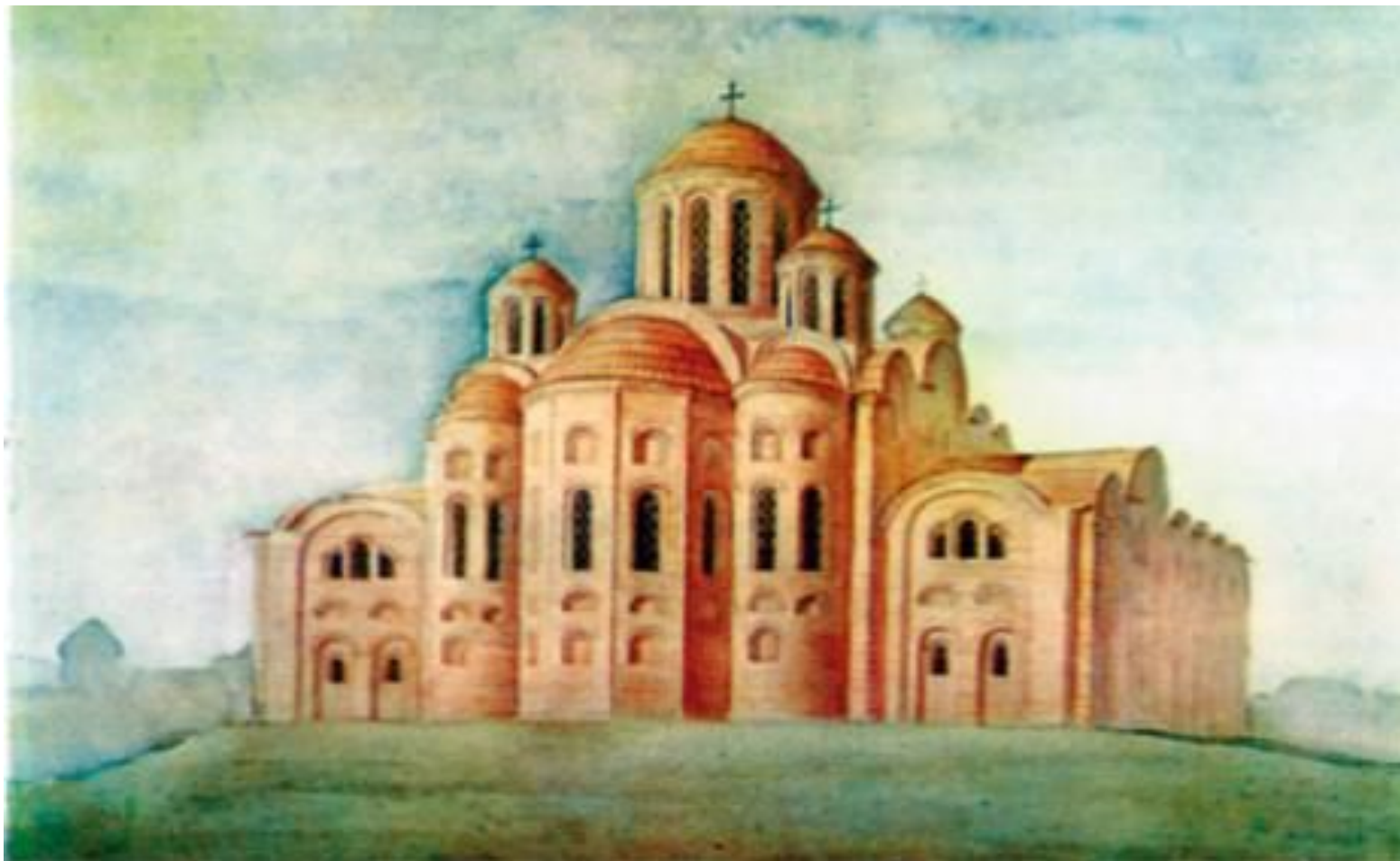
Десятинная церковь. 989-996гг строительства. Князь Владимир Святославич