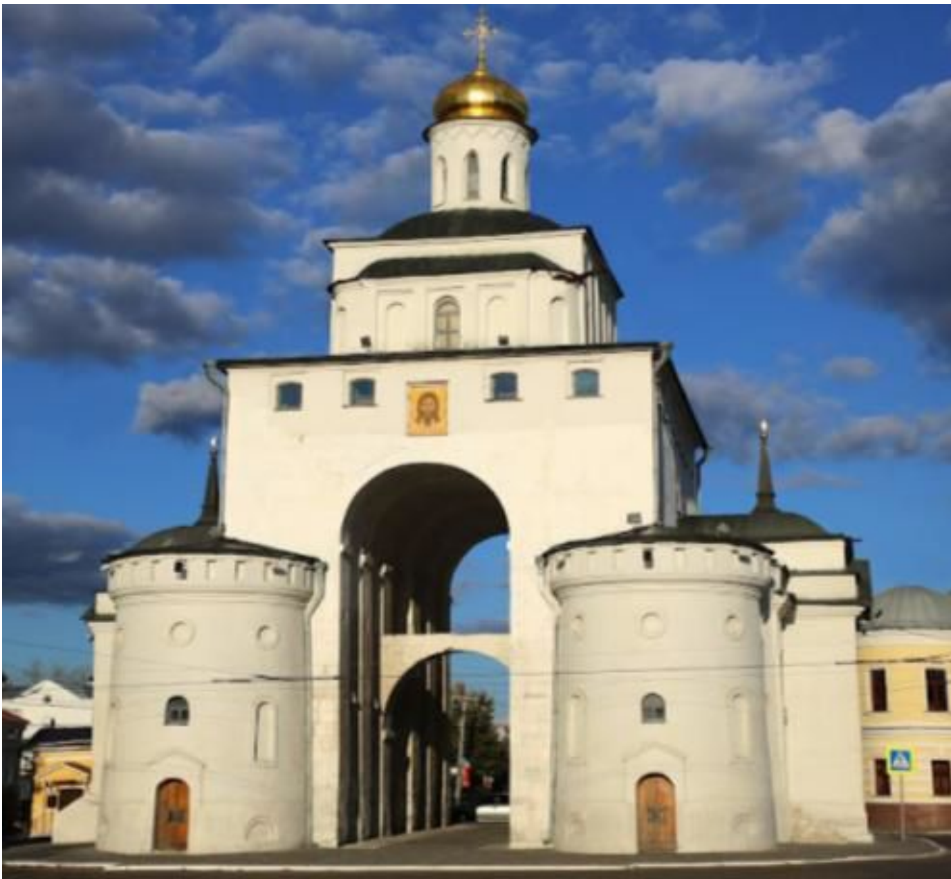
Золотые ворота во Владимире. Постройка 1164 г. При князе Андрее Боголюбском