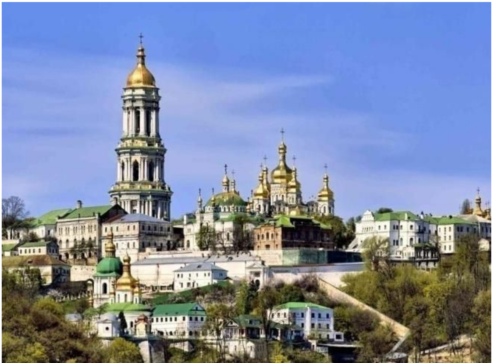
Киево-Печерская лавра, основана в 1051 г. монахами Антонием и Феодосием при Ярославе Мудром.