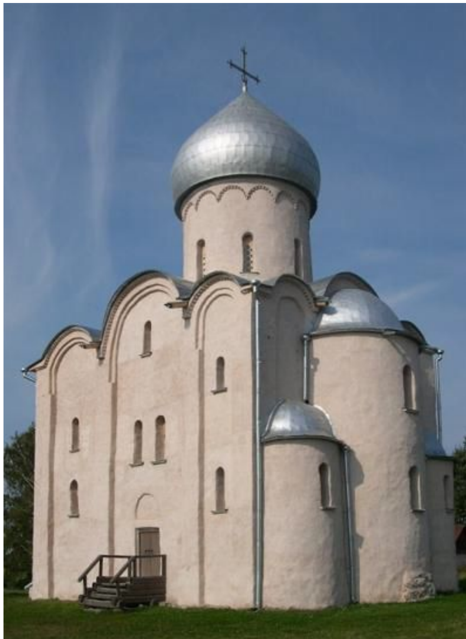
Церковь Спаса на Нередице – храм Преображения Господня.