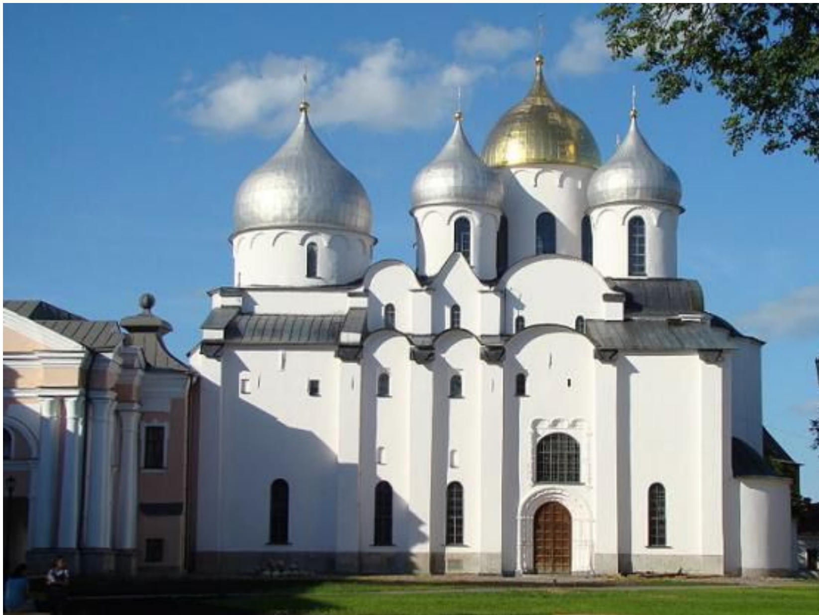
Софийский собор в Новгороде 1045-1050. Кафедральный собор Новгородской республики