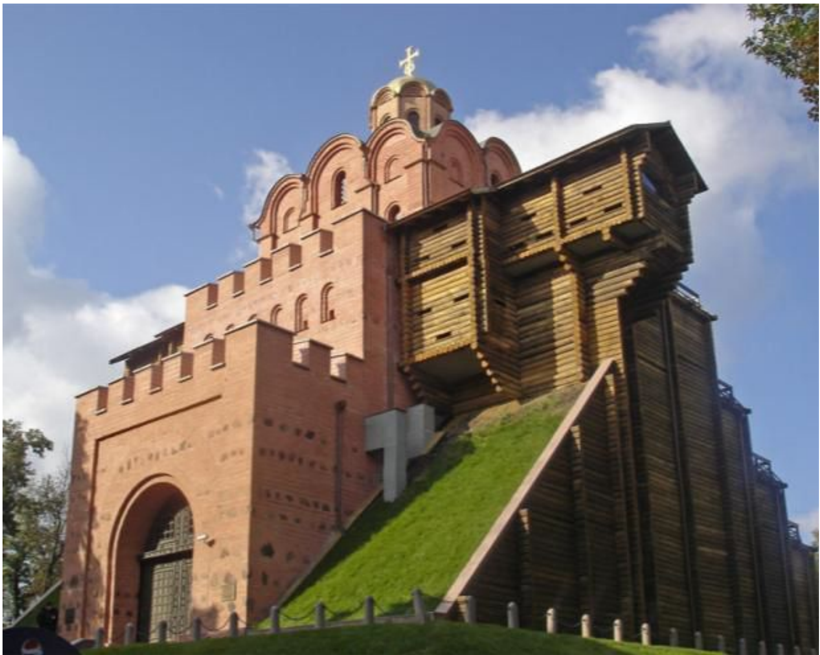
Золотые ворота в Киеве. Ярослав Мудрый. Строительство 1019 – 1026 гг.