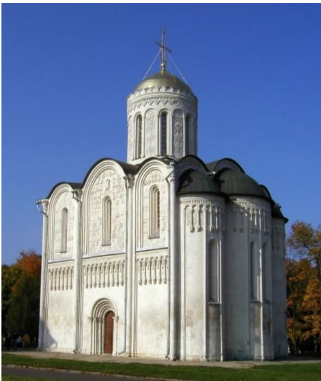
Дмитриевский собор во Владимире. Всеволод Большое Гнездо.