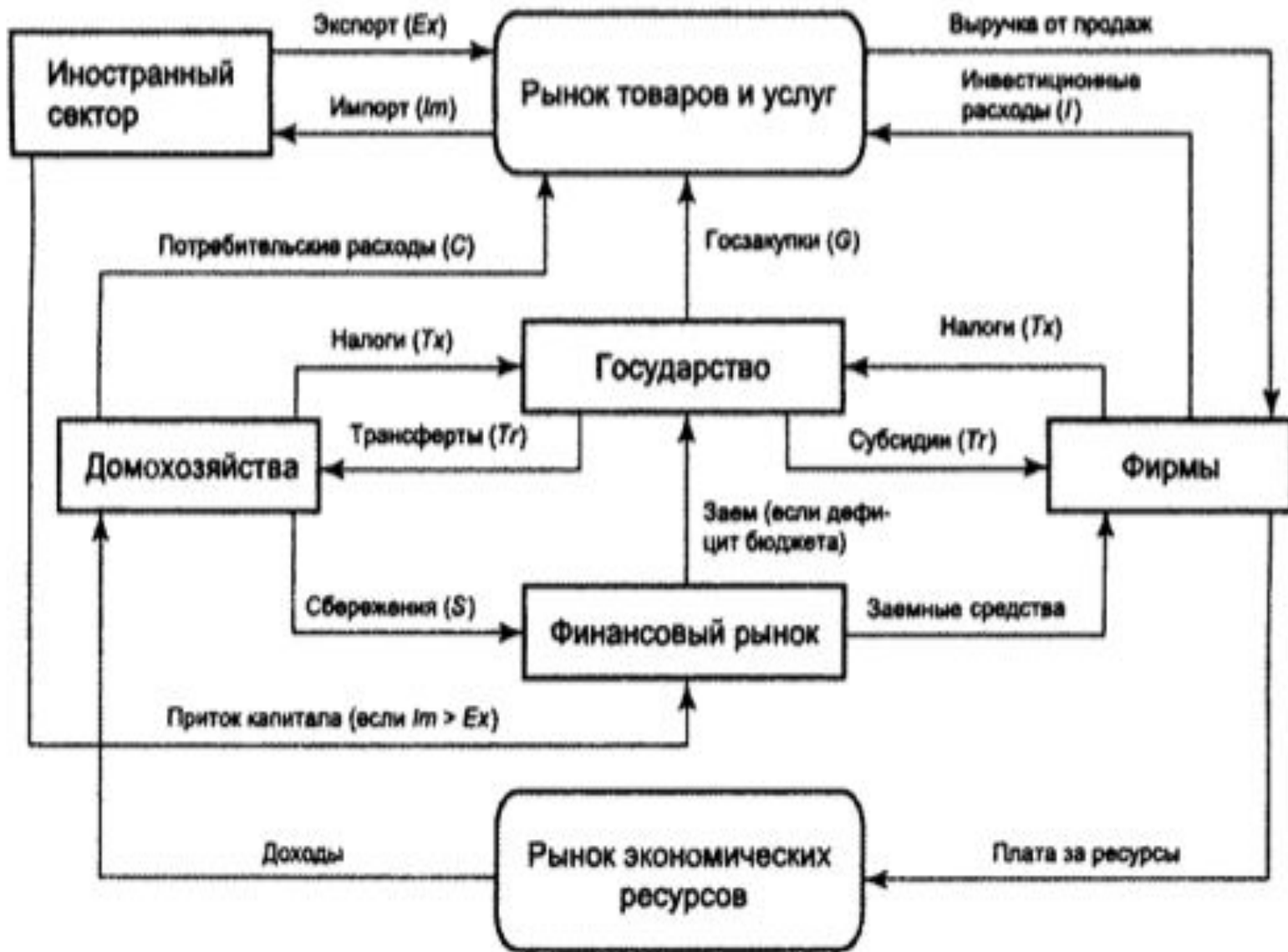
Модель открытой экономики