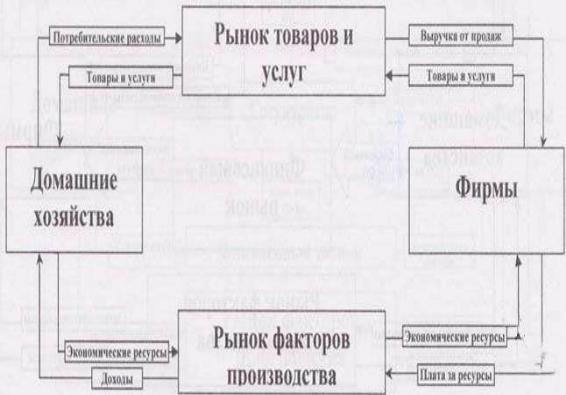
Модель закрытой экономики