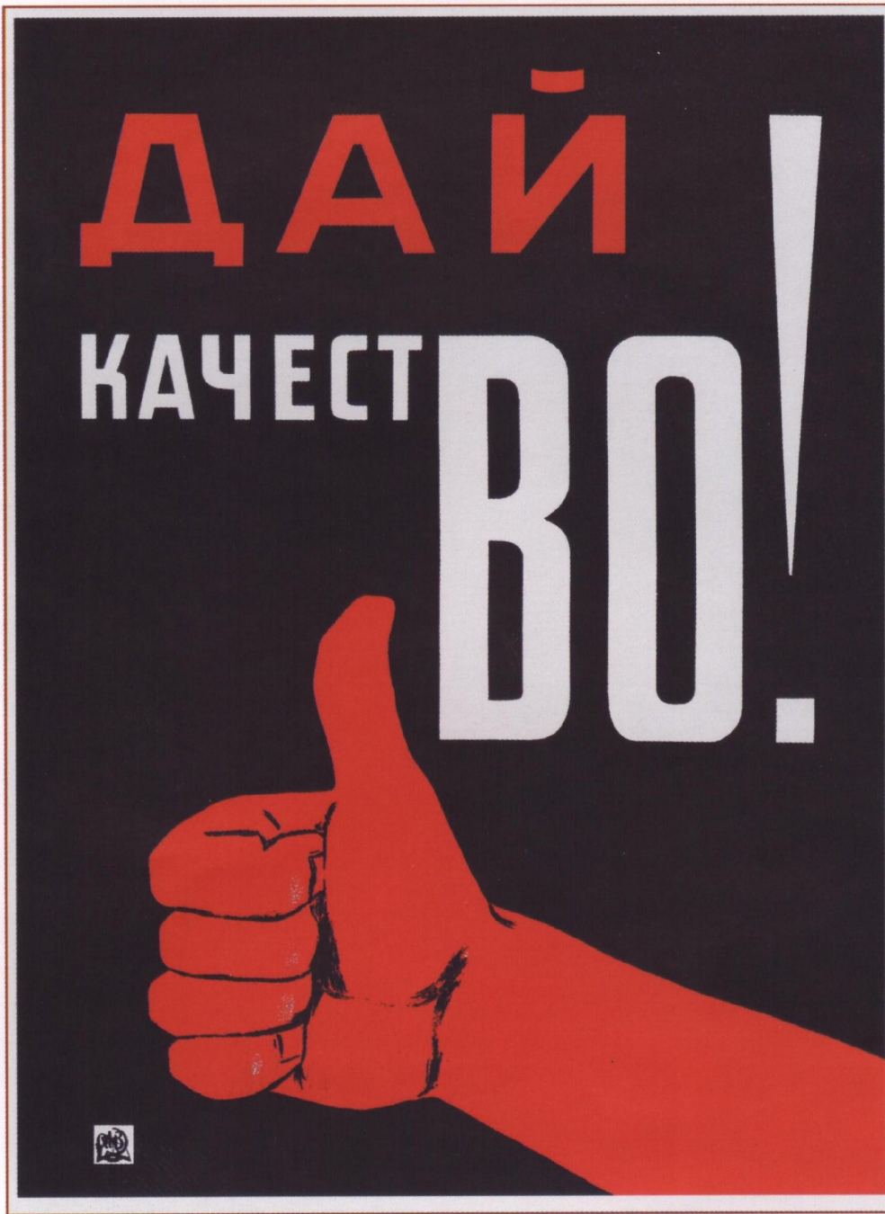
344. Неизвестный художник Дай качество! 1931