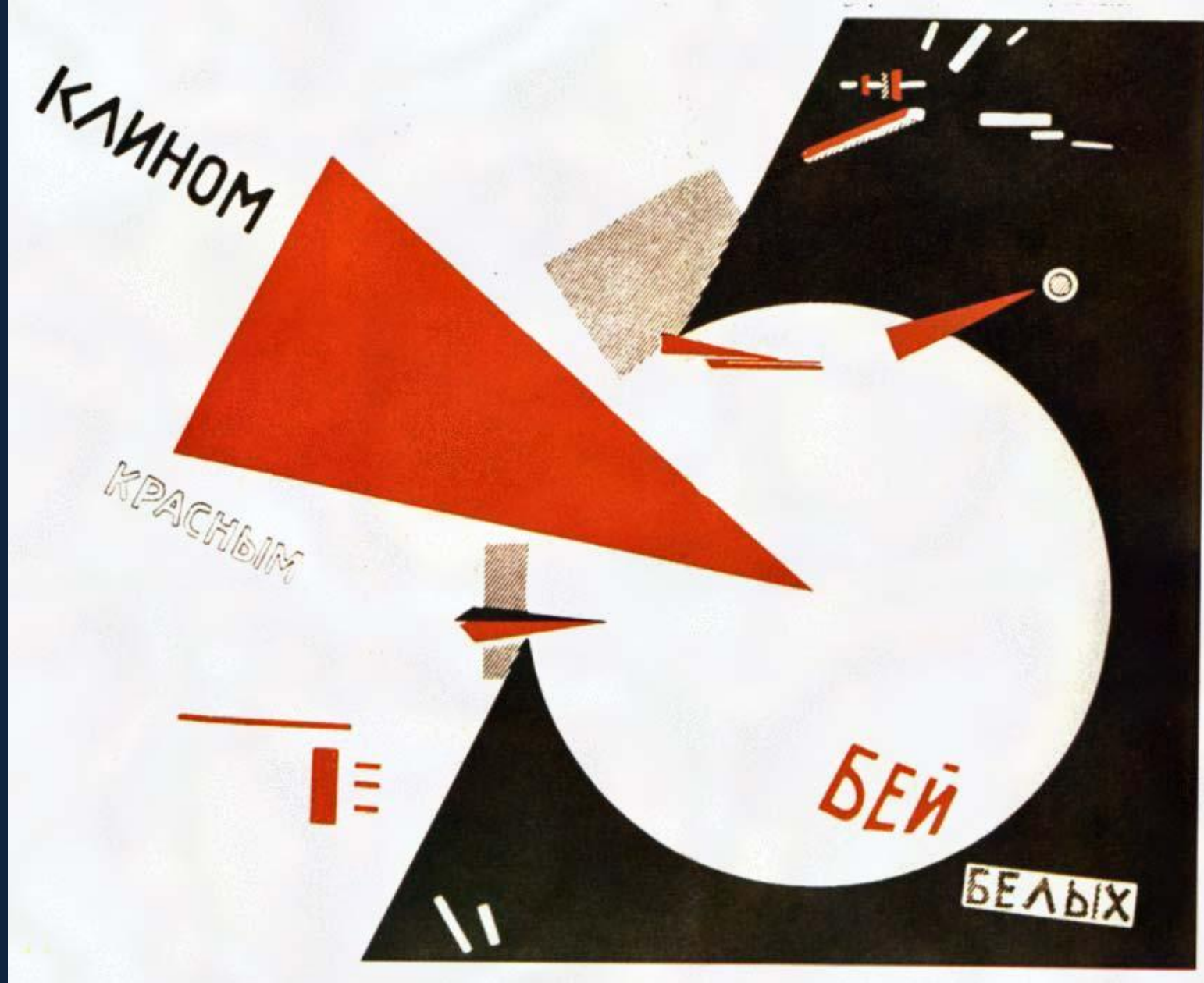
Плакат и средства его создания