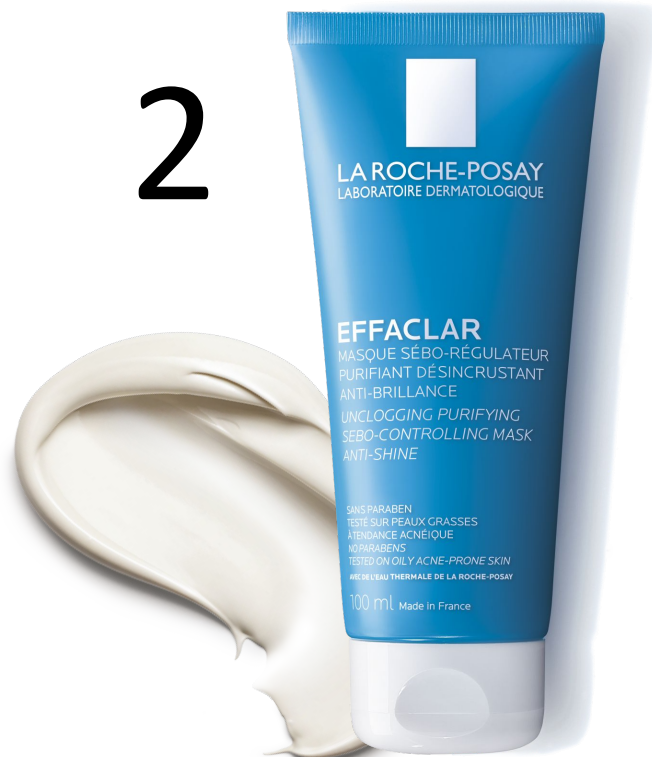
МАСКА Ефаклар для глибокого очищення