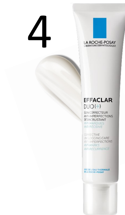
Догляд Ефаклар Дуо (+) Комплексний корегуючий засіб