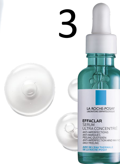
СИРОВАТКА Ефаклар з ефектом пілінгу