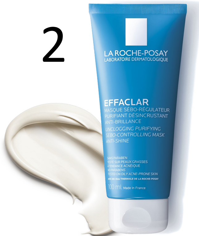
МАСКА Ефаклар для глибокого очищення