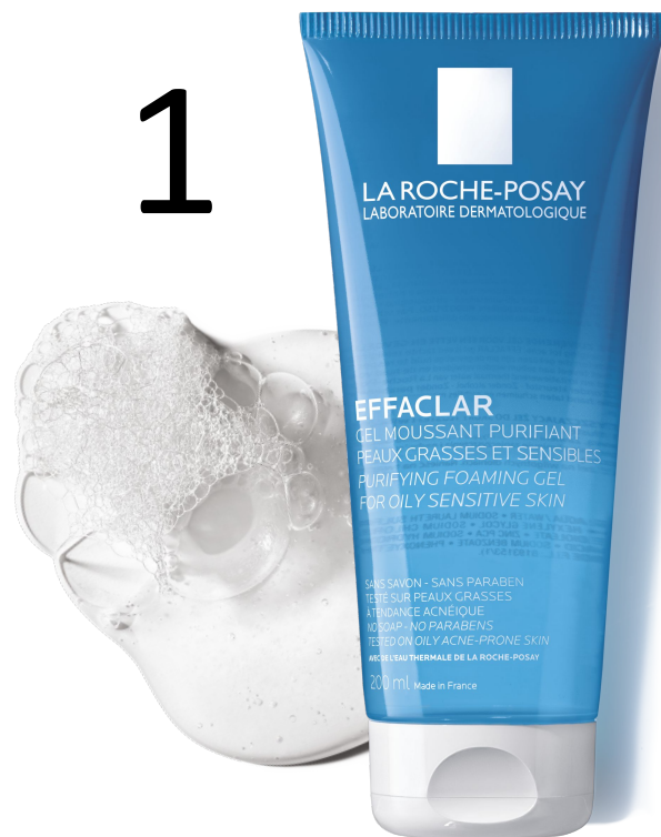
ОЧИЩЕННЯ Гель-мус Ефаклар