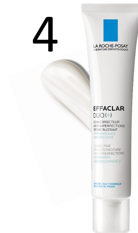
Догляд Ефаклар Дуо (+) Комплексний корегуючий засіб