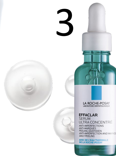
СИРОВАТКА Ефаклар з ефектом пілінгу