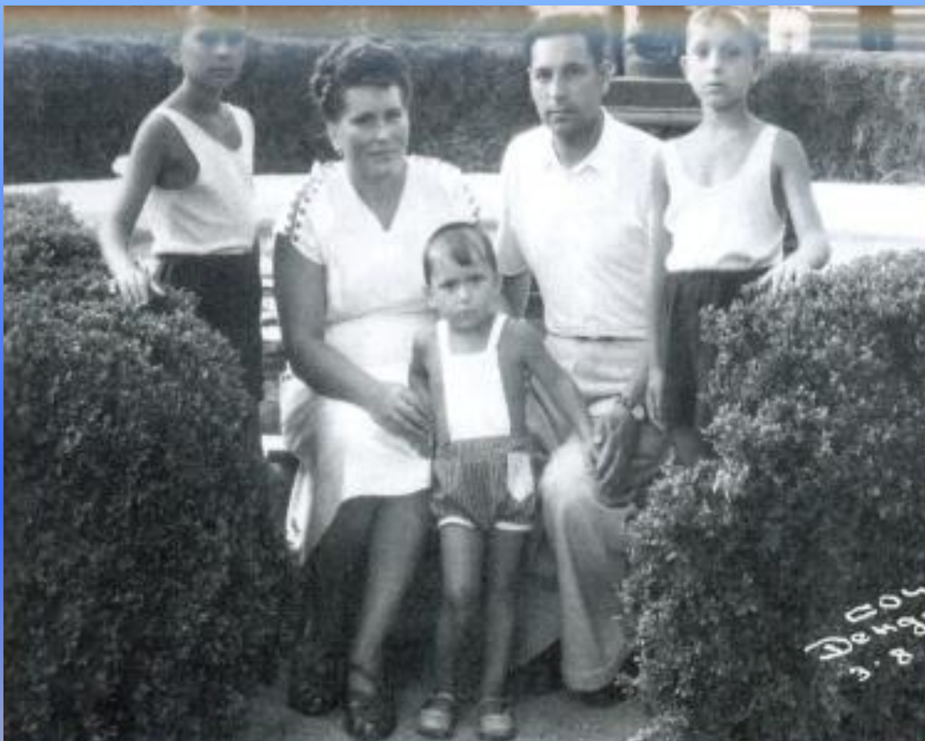
На отдыхе в г. Сочи, 1956 год