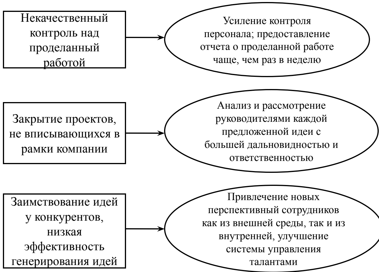
Рисунок 3 – Недостатки в деятельности Google Inc. и способы их исправления