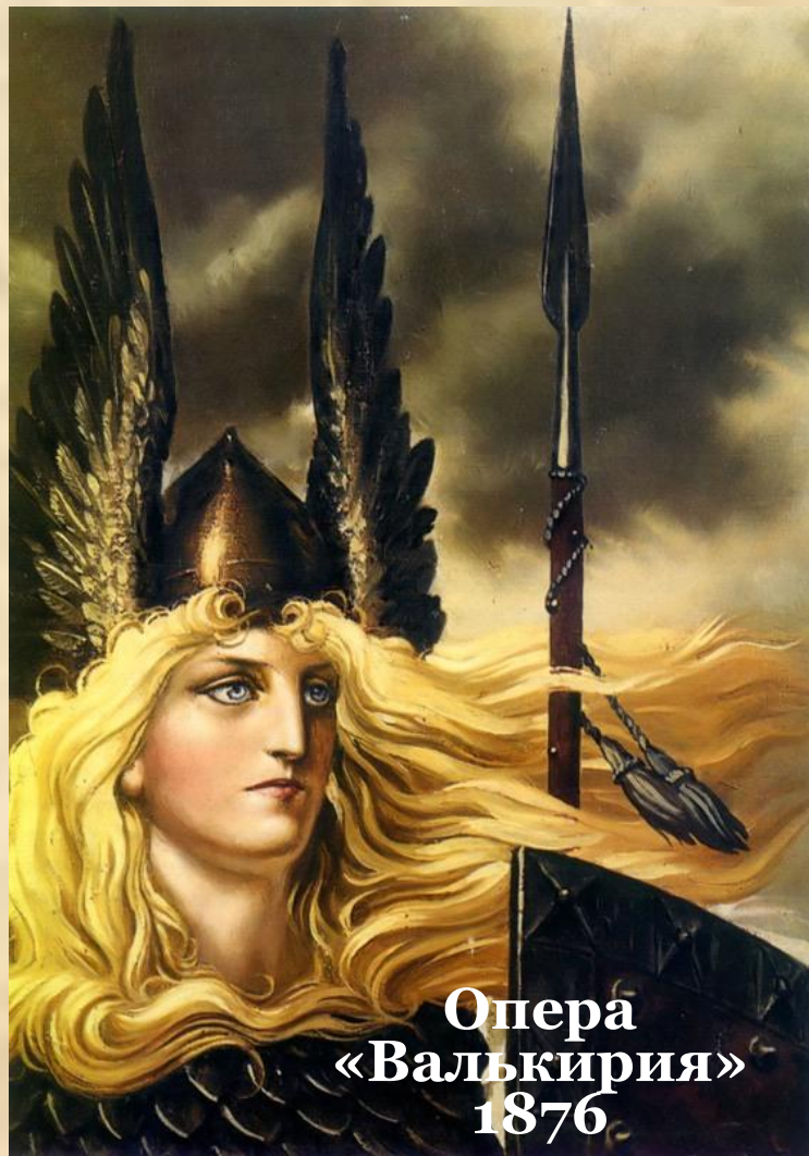
Опера «Валькирия» 1876