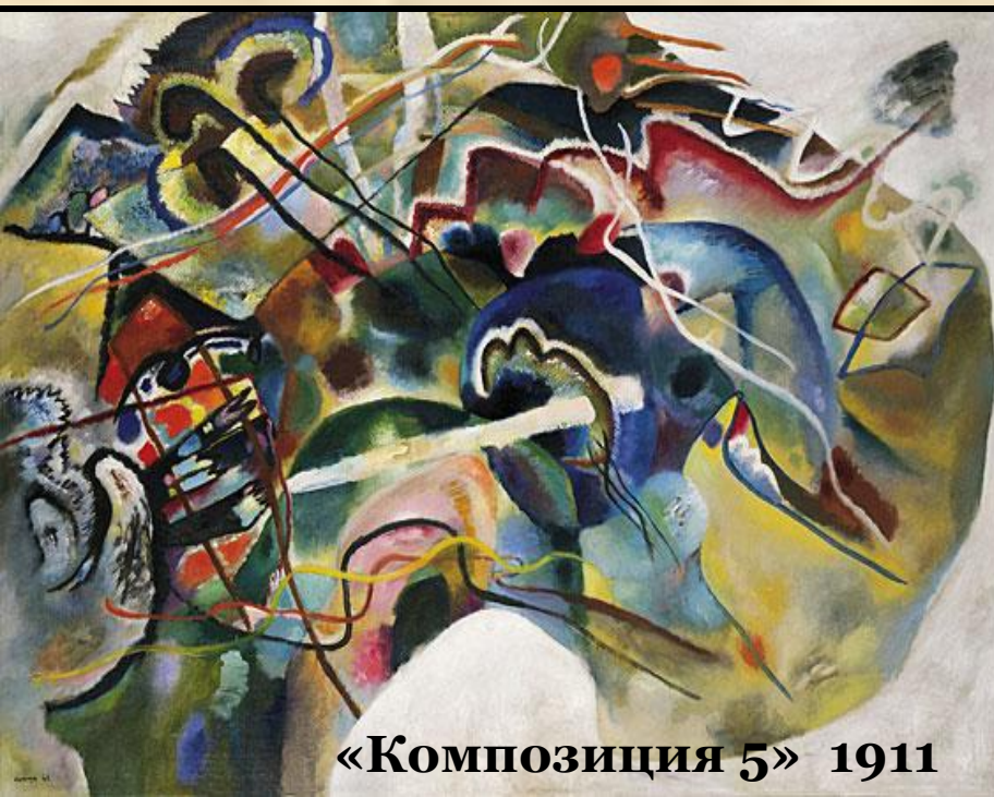
«Композиция 5» 1911