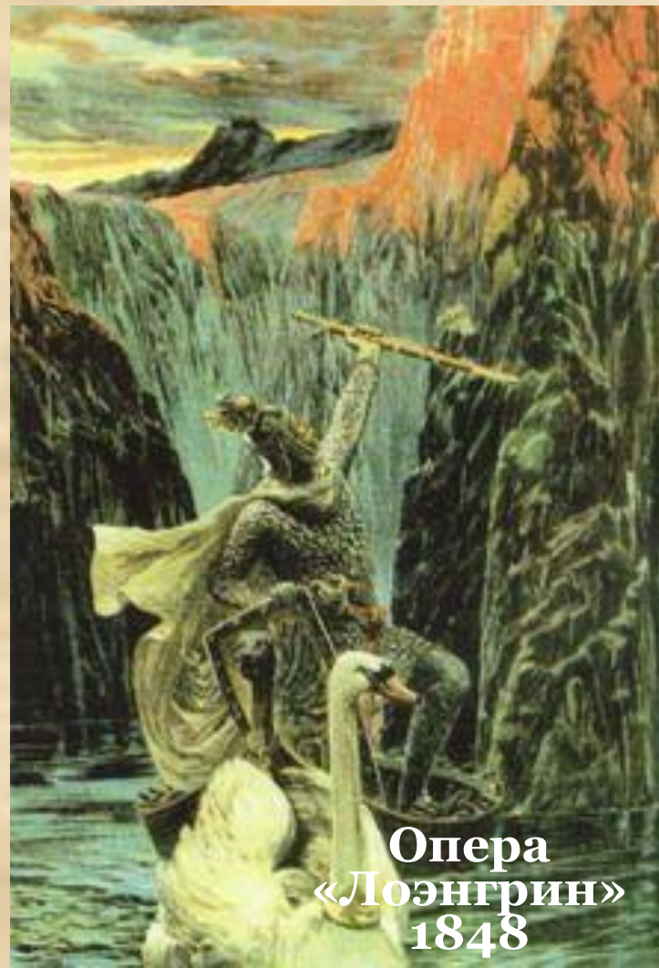
Опера «Лоэнгрин» 1848