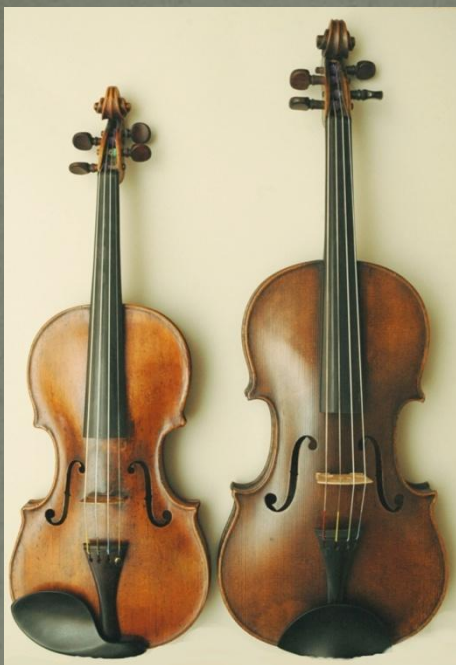
Скрипка и Альт