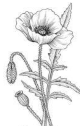
Зарисовки Худеющая ...