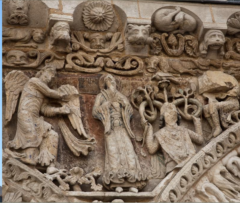
Фриз на западном фасаде