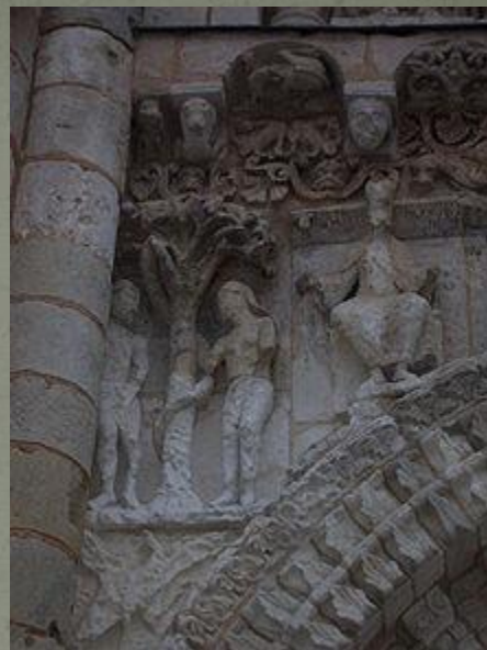
Фрагмент фриза, где изображены Адам, Ева и Навуходоносор II

И наконец, ещё выше находится представление Второго Пришествия Христа (или Судный день) — Иисус показан вертикально стоящим в мандорле в окружении Херувимов, Солнца и Луны.