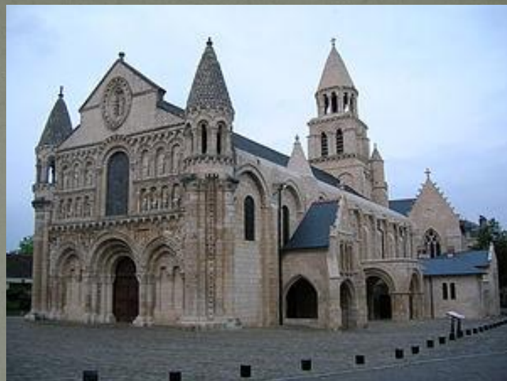
Церковь Нотр-Дам-ля-Гранд, вид с юго-запада

Колокольня церкви датируется XI веком. Первоначально она была значительно заметнее: первый уровень сегодня скрадывается крышами окрестных зданий. Колокольня расположена на месте скрещения , имеет квадратную форму и круговой купол , отделанный черепицей. Купола такого типа, распространенные на юго-западе Франции, часто копировались архитекторами XIX века, к примеру Подем Абади в городах Ангулем, Перигё и Бордо.