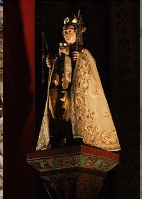
Скульптура Девы Марии, державшей городские ключи