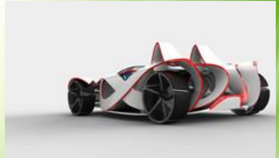
Уникальная форма кузова в форме ленты Мебиуса обеспечивает гоночной машине хорошую аэродинамику