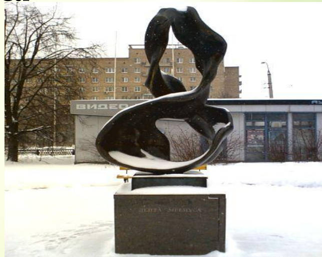
Памятник в Москве