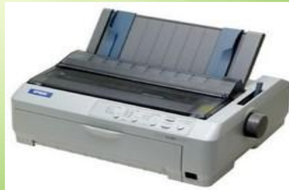
красящая лента также имеет вид листа Мёбиуса для увеличения её ресурса.

Уникальная форма кузова в форме ленты Мебиуса обеспечивает гоночной машине хорошую аэродинамику