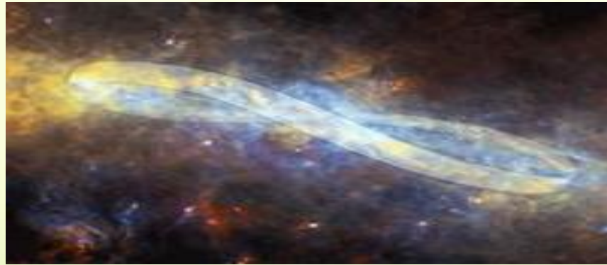
Знак бесконечности в виде в центре нашей галактики – Млечного пути.