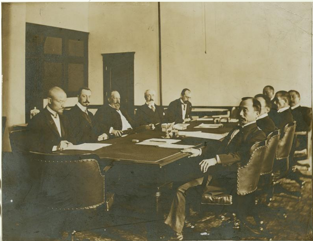
Переговоры в Портсмуте