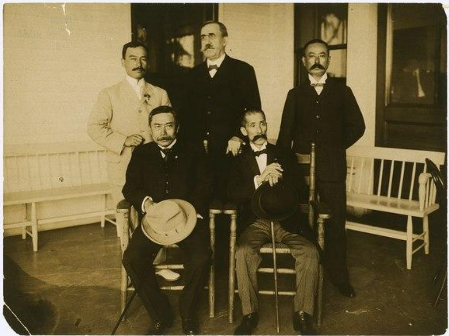
Японская делегация в Портсмуте