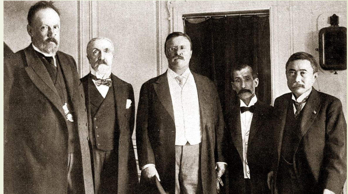
Граф Витте, барон Розен, президент Теодор Рузвельт, барон Комура и М. Такахира на борту «Мэйфлауэр».

В инструкции нет ясности об участии острова Сахалин