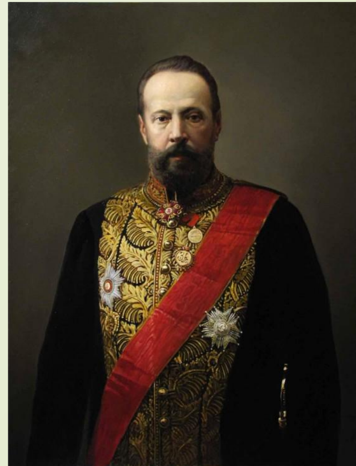
Сергей Юльевич Витте