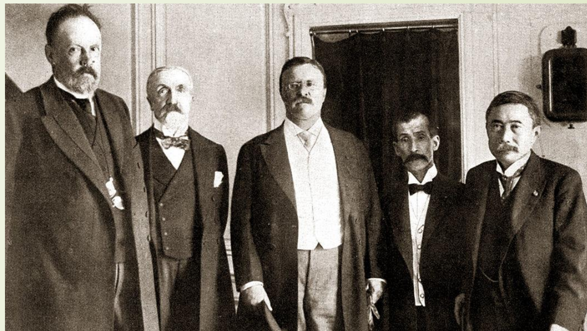
Граф Витте, барон Розен, президент Теодор Рузвельт, барон Комура и М. Такахира на борту «Мэйфлауэр».

В инструкции нет ясности об участии острова Сахалин