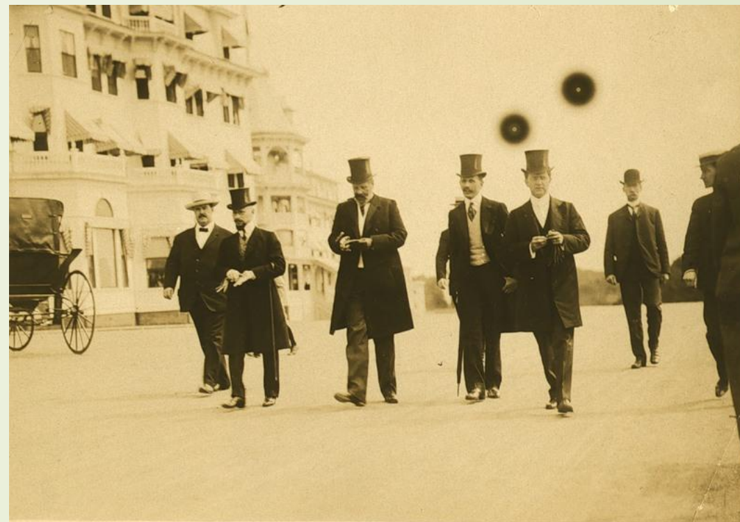
Витте и члены делегации на прогулке по Портсмуту