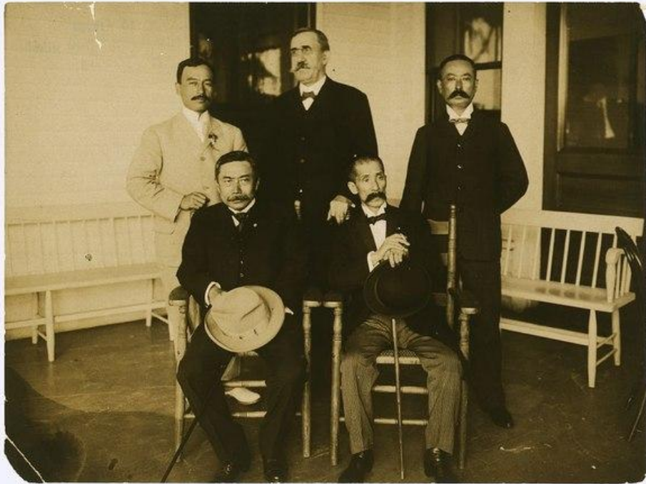
Японская делегация в Портсмуте