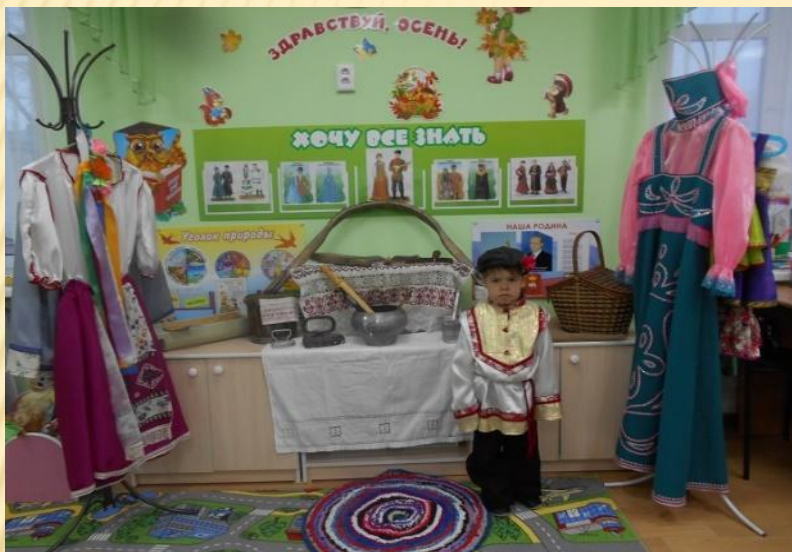
Музей игрушек «Народные забавы»