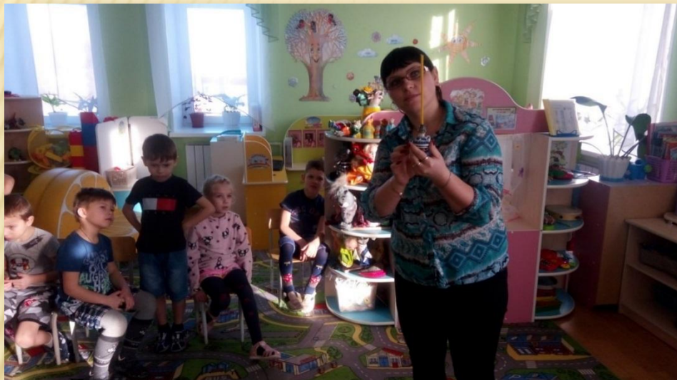
«Дети остались очень довольны своими успехами, новыми открытиями и возможностью побывать в здании Воскресной