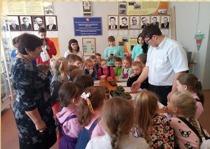
«Совместное проведение акции «Бессмертный полк России»»