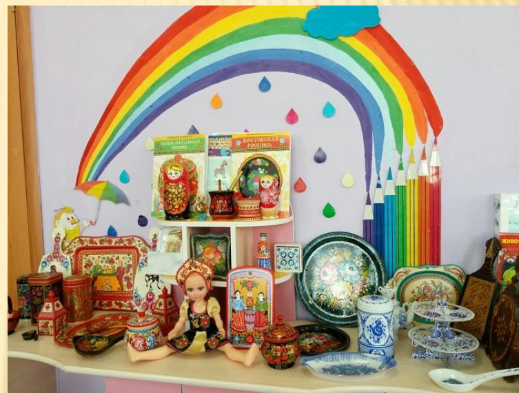
Музей «Город мастеров. Умельцы Южного Урала»