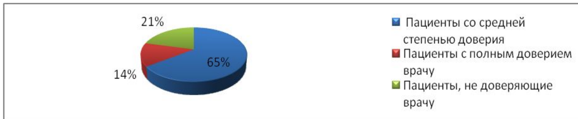
Рис.1 Структура доверия пациентов врачам среди жителей г. Уфы на 2019 год