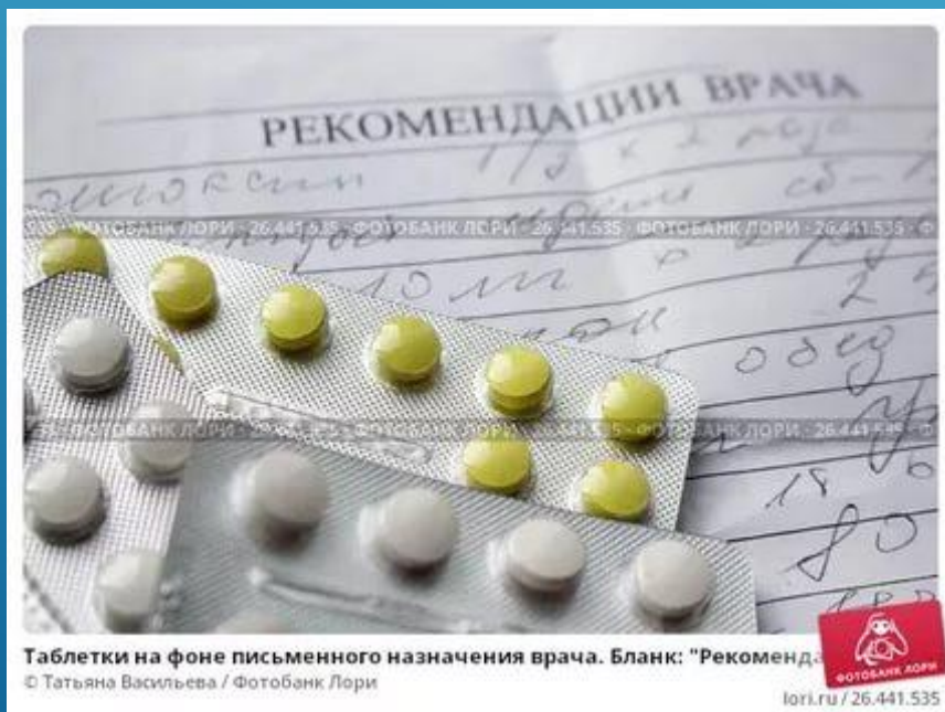
Таблетки на фоне письменного назначения врача. Бланк: "Рекомендации".

Рецепт, не отвечающий хотя бы одному из перечисленных требований или содержащий несовместимые лекарственные средства, считается недействительным.