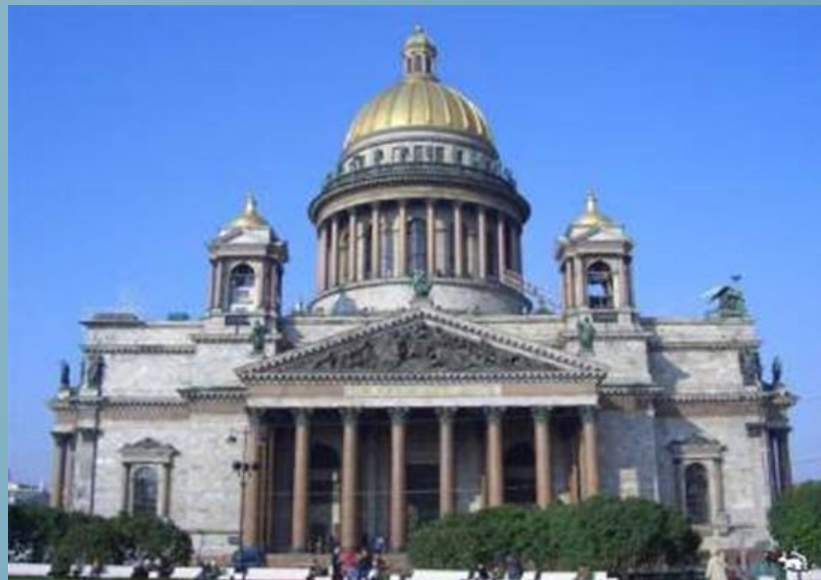
Исаакиевский собор. Санкт – Петербург. А. Монферран