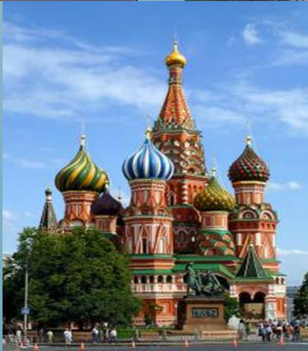
Собор Василия Блаженного. Москва. Барма и Постник