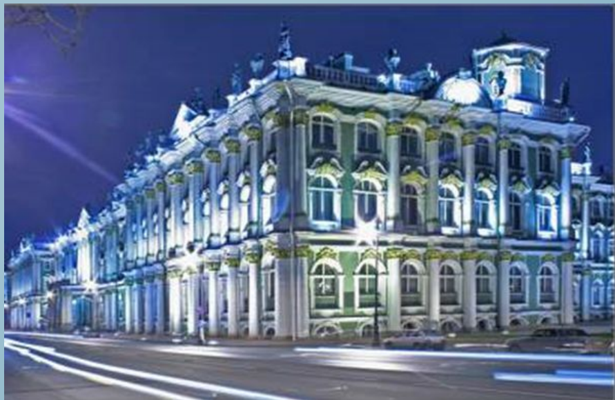
Зимний дворец. Санкт-Петербург. Растрелли.