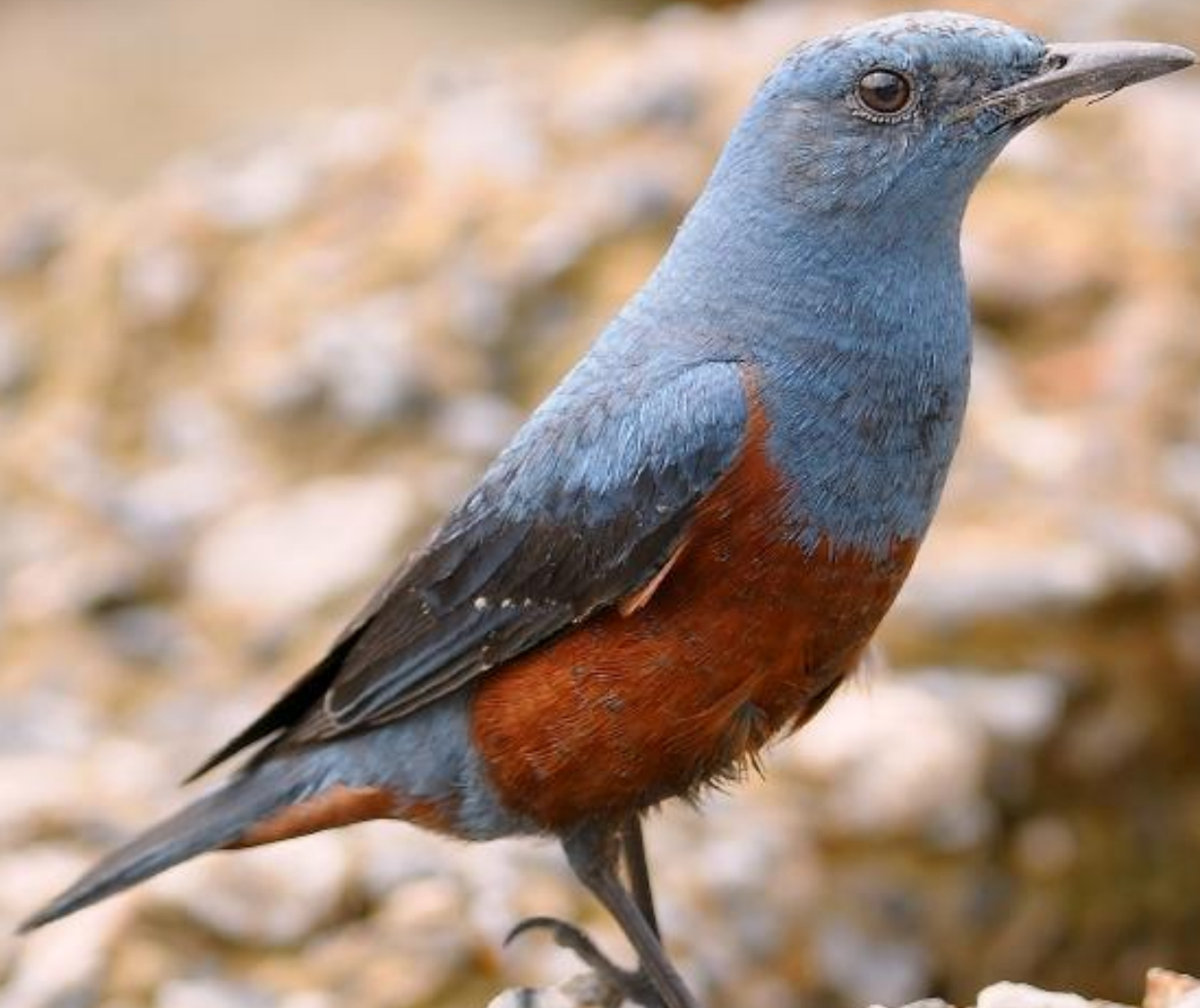
Синий каменный дрозд