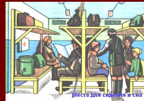
Места для сидения и сна