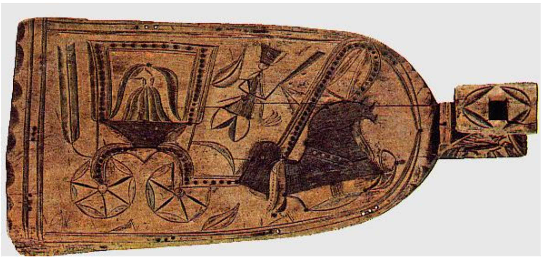
Горделивый конь оказался запряженным в карету.