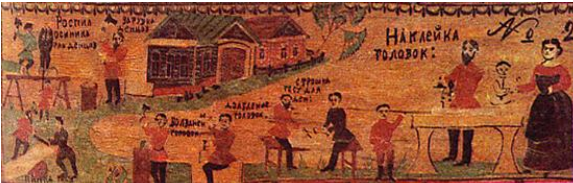
В 1935 году художник Игнатий Мазин на доске нарисовал, как в старое время изготовляли