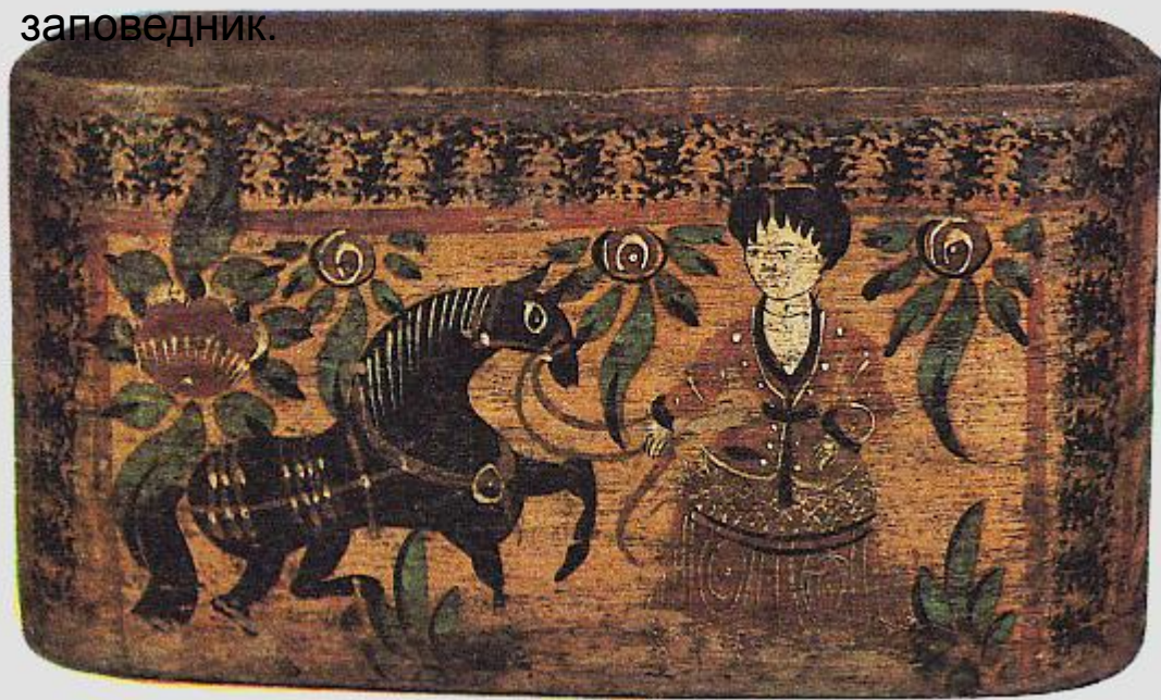
Этот конь украшает лубяную коробку для веретен и мотков ниток.