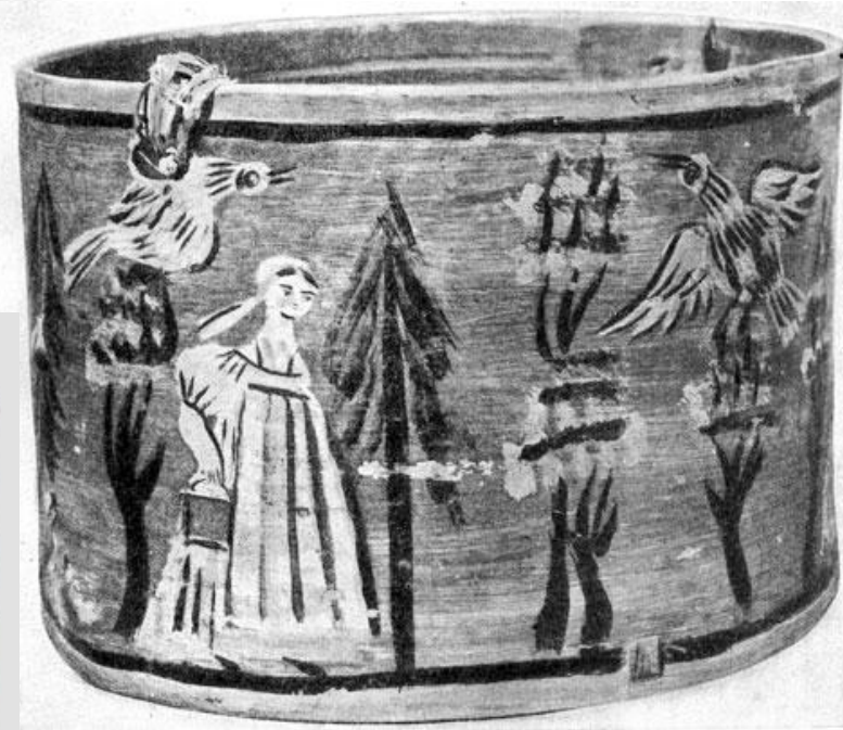
Лукошко. В лесу. Роспись. Луб, темпера, 1850-е годы. Горьковский Государственный историко-архитектурный музей-заповедник.