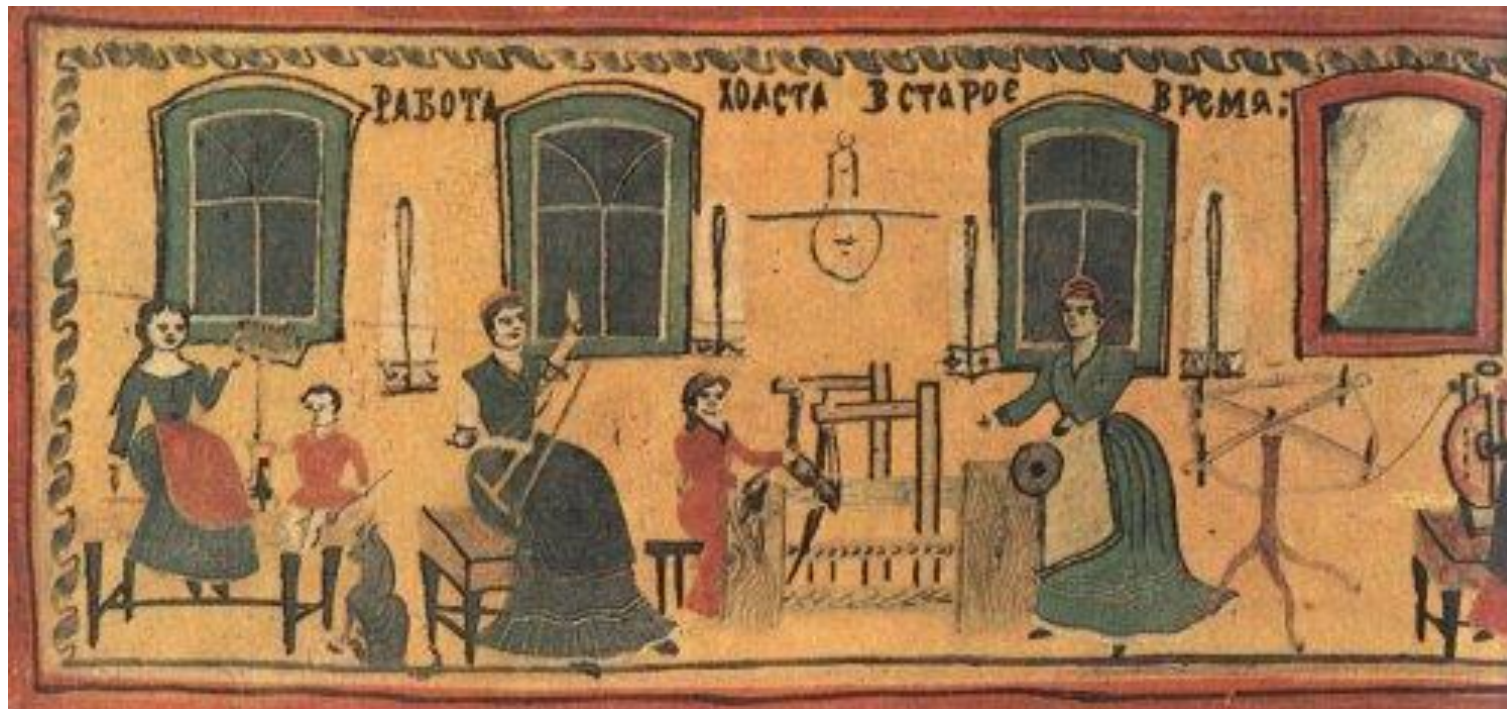
донце, нач 20 века