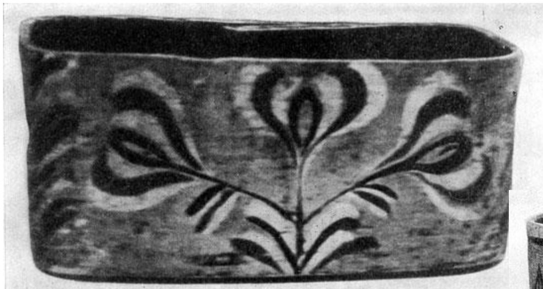
Мочесник. Цветы. Роспись. Луб, темпера, 1850-е годы. Кострома, Историко-архитектурный музей-заповедник.