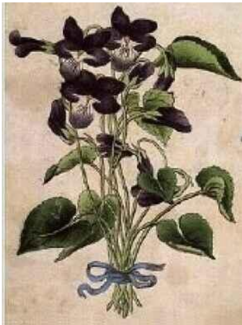
Наполеон, его жена и их сын