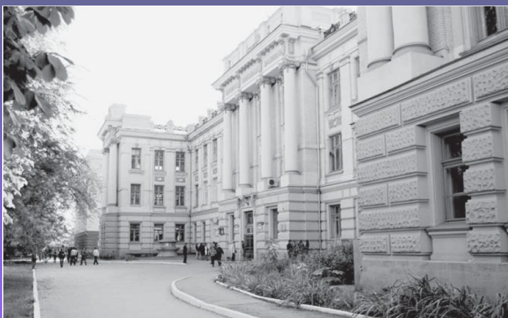
Первый корпус СГУ, в котором в 1942–1944 гг. работали и учились химики и геологи ЛГУ