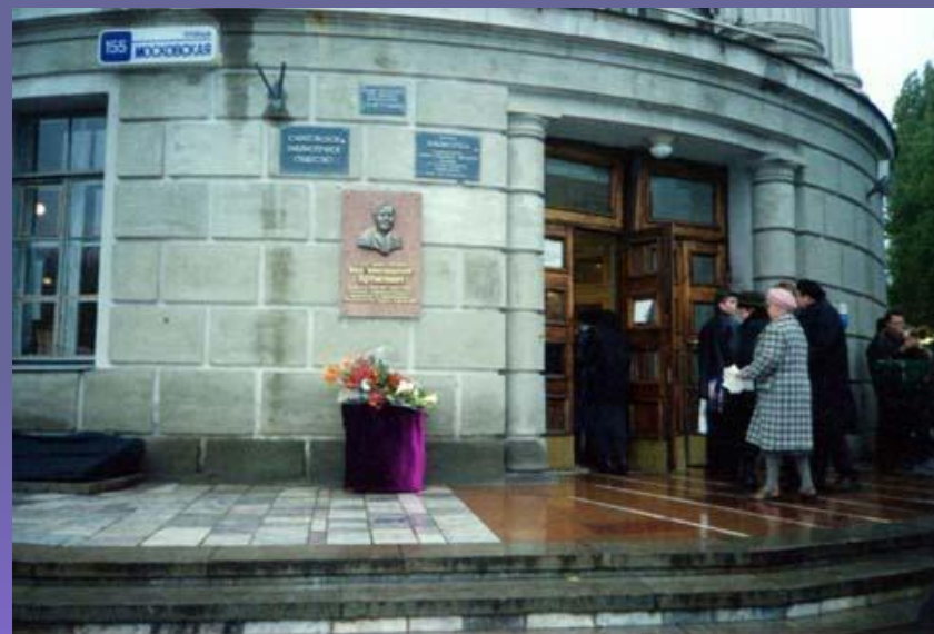
Открытие мемориальной доски