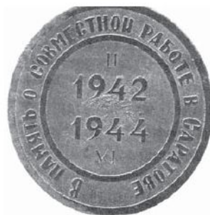
Памятный знак ЛГУ «В память о совместной работе в Саратове»