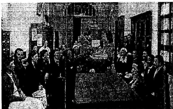
На научном семинаре НБ СГУ

29 января. Был составлен план научно-методической работы. Разработан план научных семинаров и научной конференции.