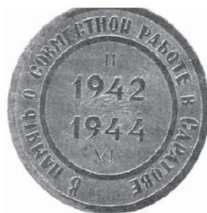
Памятный знак ЛГУ «В память о совместной работе в Саратове»