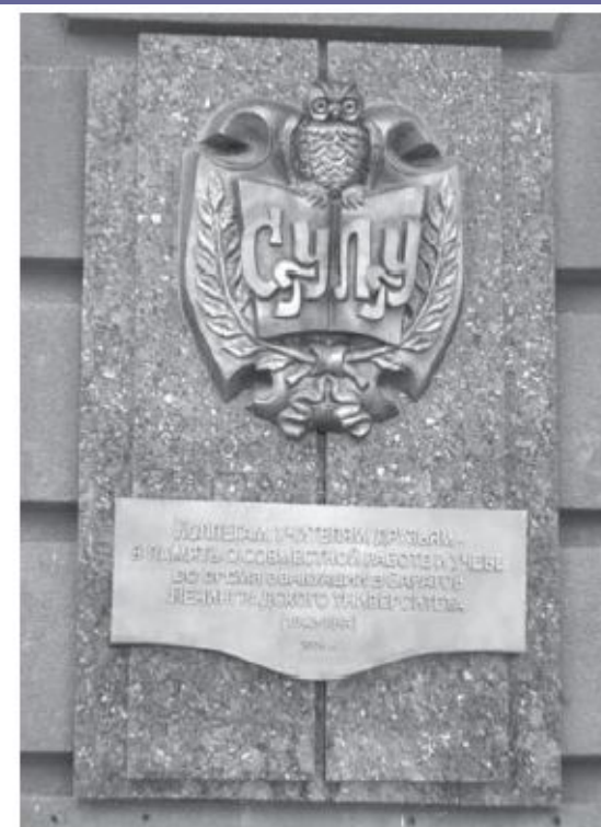
Памятный знак на X корпусе Саратовского университета в честь пребывания Ленинградского университета в Саратове.