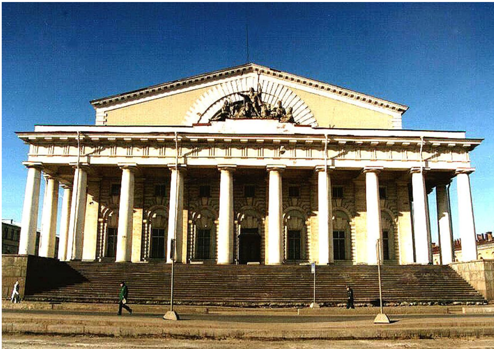
Здание биржи, архитектор А.Н. Воронихин