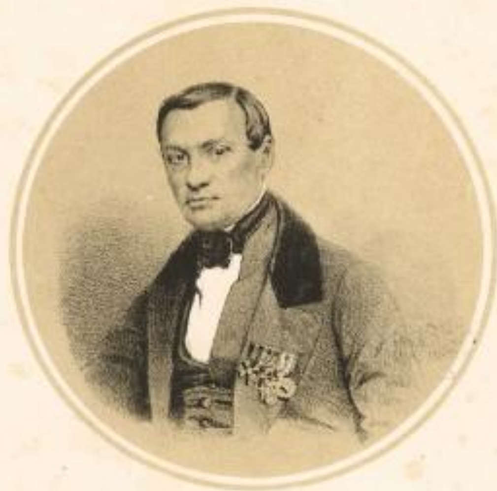
Профессоръ Скульптуры, Баронъ Петръ Карловичъ КЛОДТЪ-ФОНЪ-НЮРГЕНСБУРГЪ.