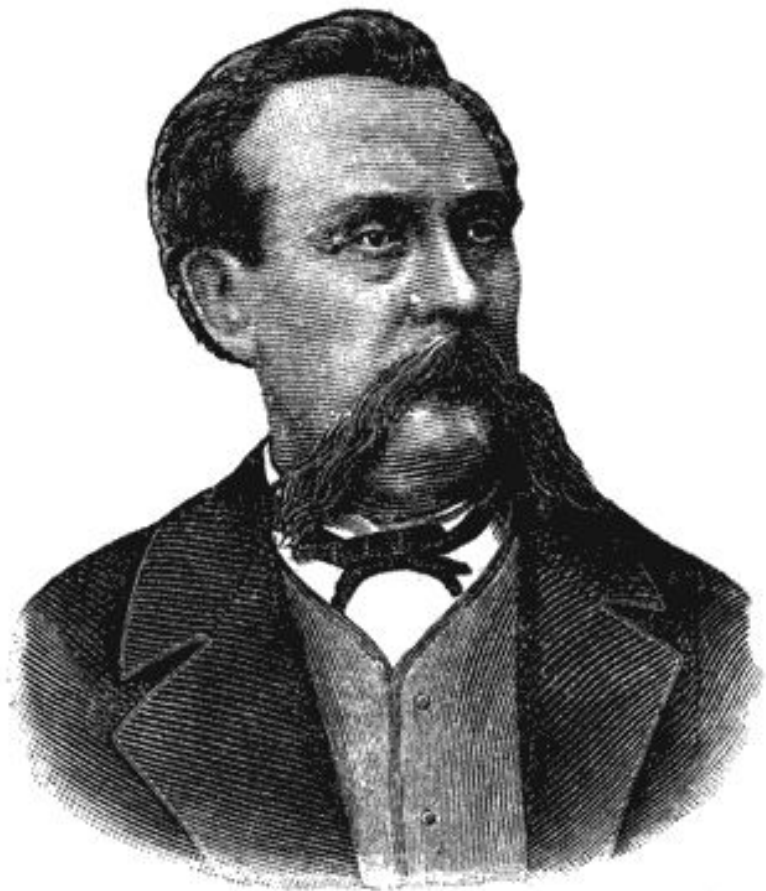
Зинин Н.Н. химик, синтезировал анилин, чем заложил основы производства красителей