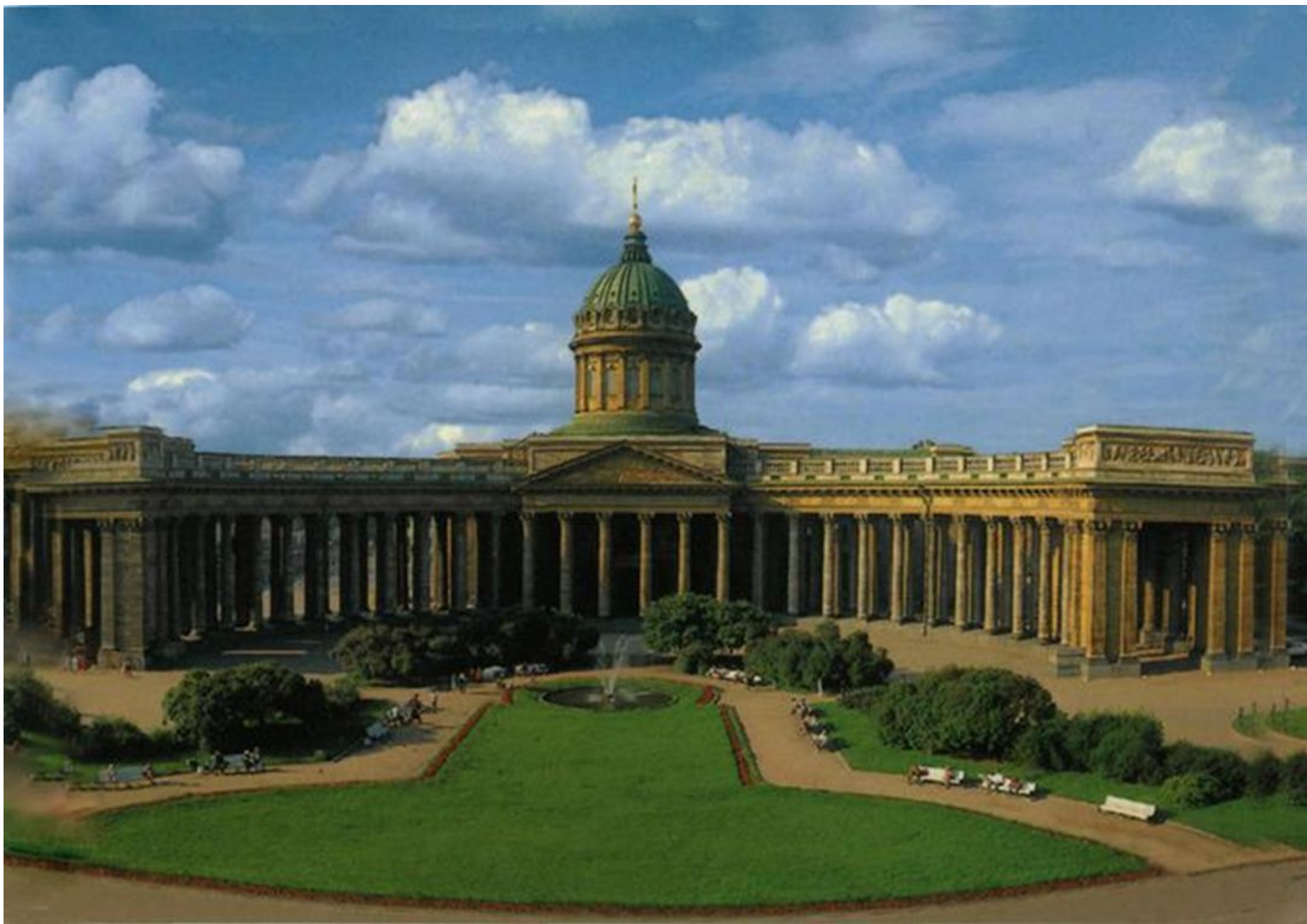
Казанский собор, архитектор А.Н.