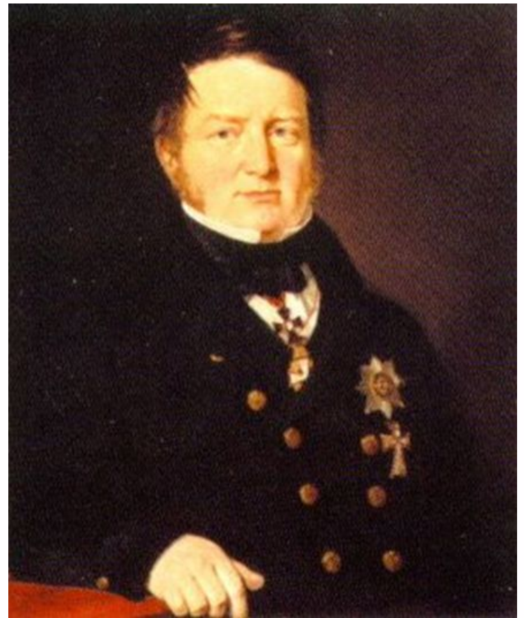
Струве В.Я. Астроном, основатель и первый директор Пулковской