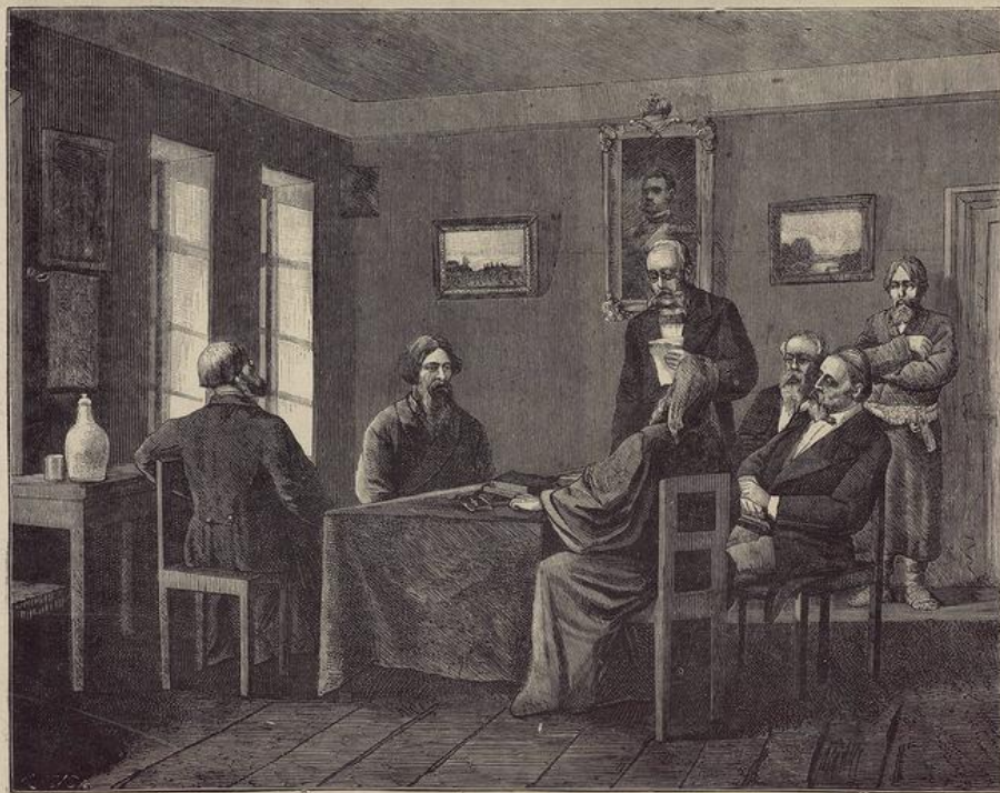
Картина Земства. Земская Уездная Управа.