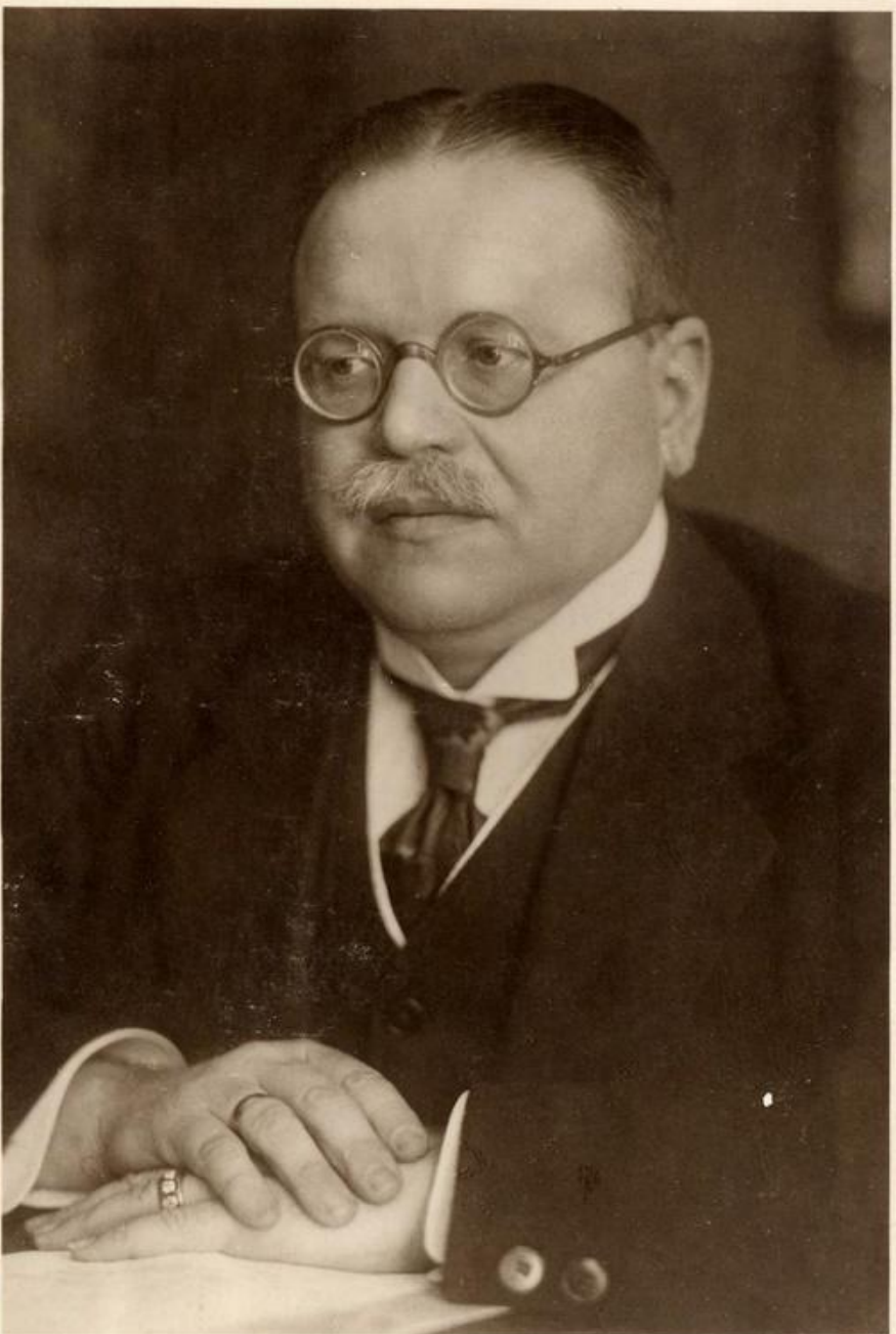
MATHIAS ERZBERGER +

Декабрь 1919 г. ознаменован крупнейшей налоговой реформой в Германии, разработанной министром финансов Эрцбергером. В итоге в Веймарской республике было создано единое финансовое управление, контролирующее поступление всех видов налогов, независимо от их последующего распределения, оно функционировало вплоть до мая 1945 г.. В ходе финансовой реформы М. Эрцбергера 1919–1920 годов были законодательно закреплены некоторые ключевые положения, развившие принципы налогообложения конституции 1919 года.