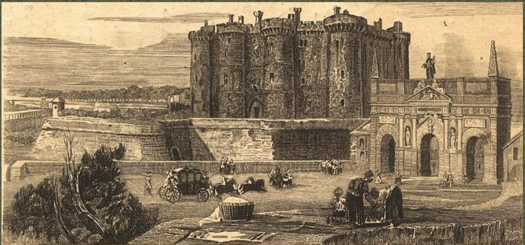
Chasteau de la Bastille 1640 (Vieux Paris)

Бастилия - крепость в западном районе Парижа, была построена в конце 14 века. Вначале служила укреплением на подступах к столице. Вскоре крепость стала выполнять функции тюрьмы.