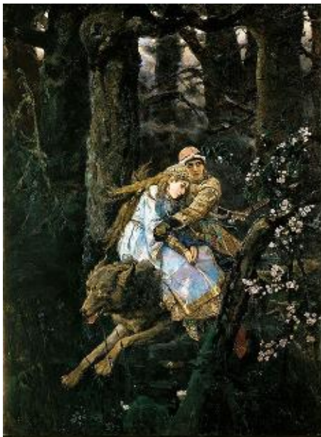
«Иван-Царевич на Сером Волке»