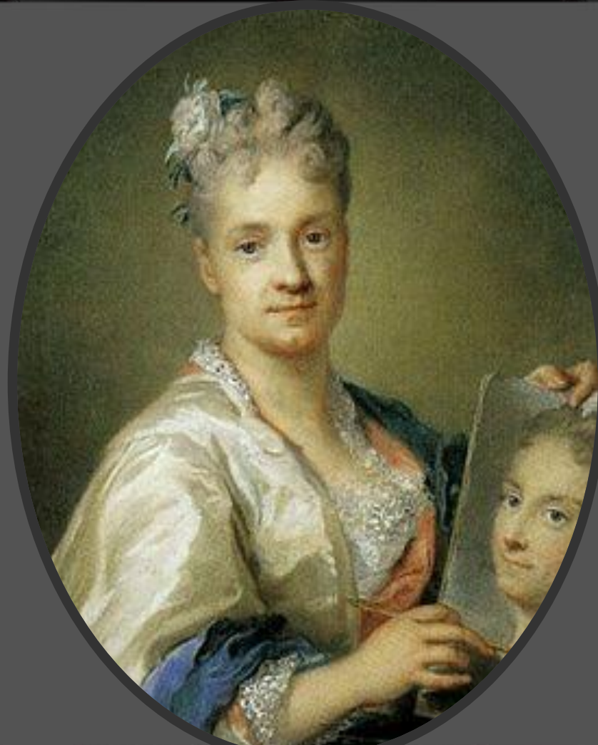
Автопортрет с портретом сестры, 1715 г.