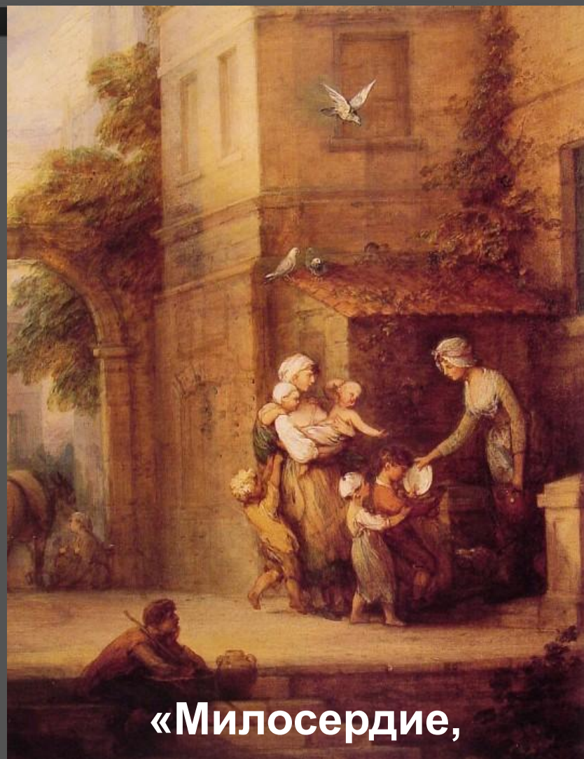
«Милосердие, облегчающее страдание»