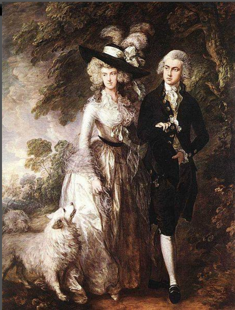
«Утренняя прогулка» (1785)