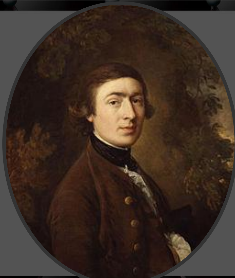
Автопортрет, около 1759 г.