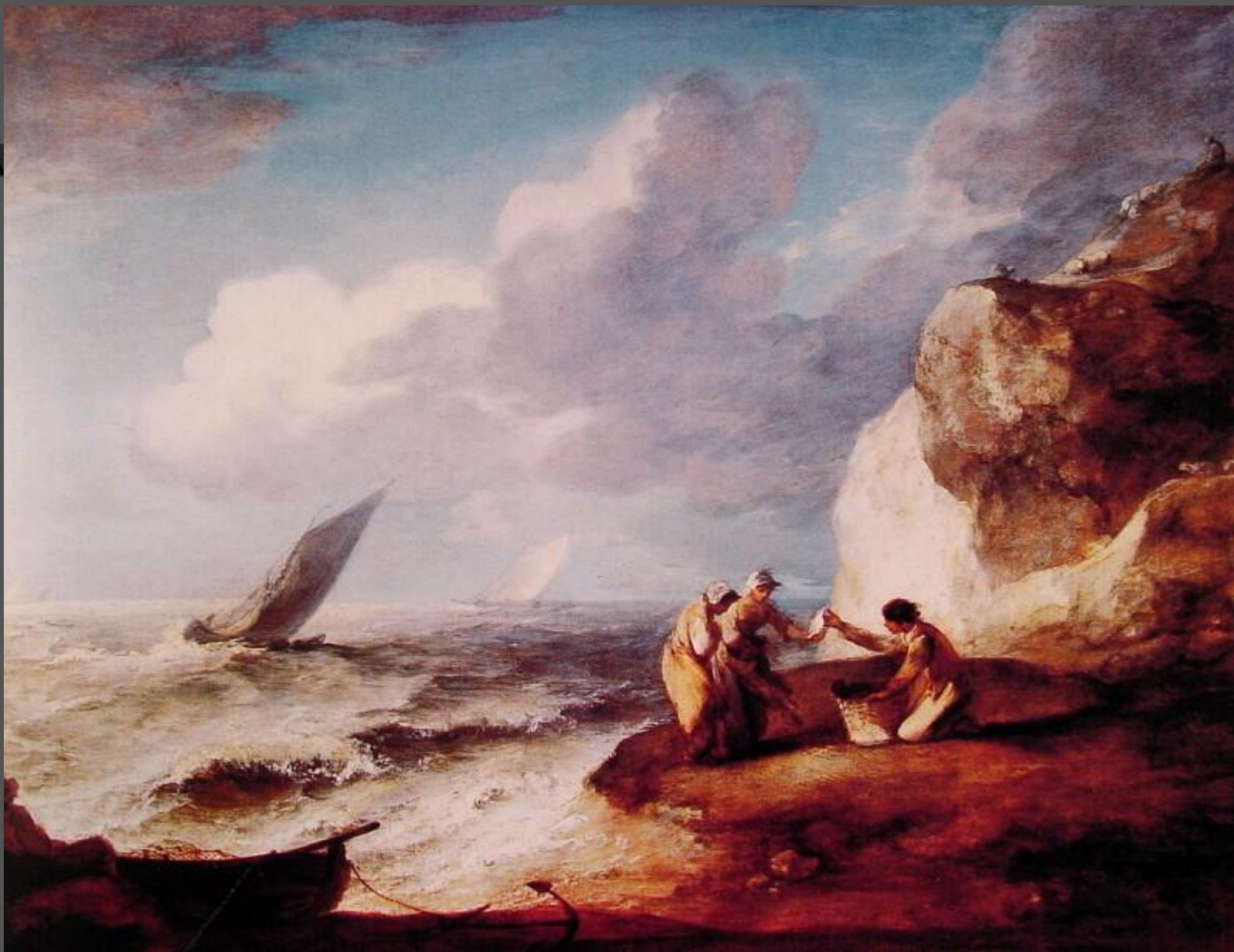
Сцена на скалистом берегу