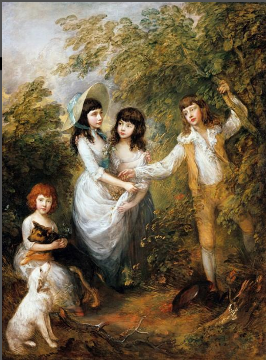
Дети семьи Маршем