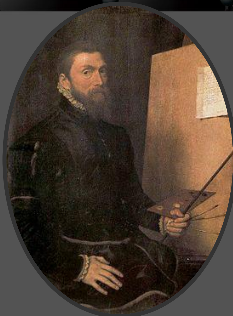
Автопортрет, 1558 г., Галерея Уффици