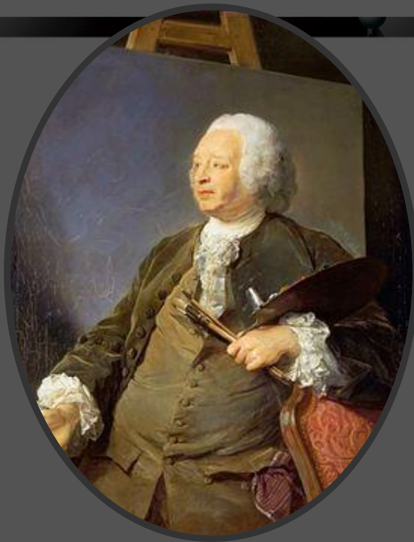
Портрет Удри работы Перронно