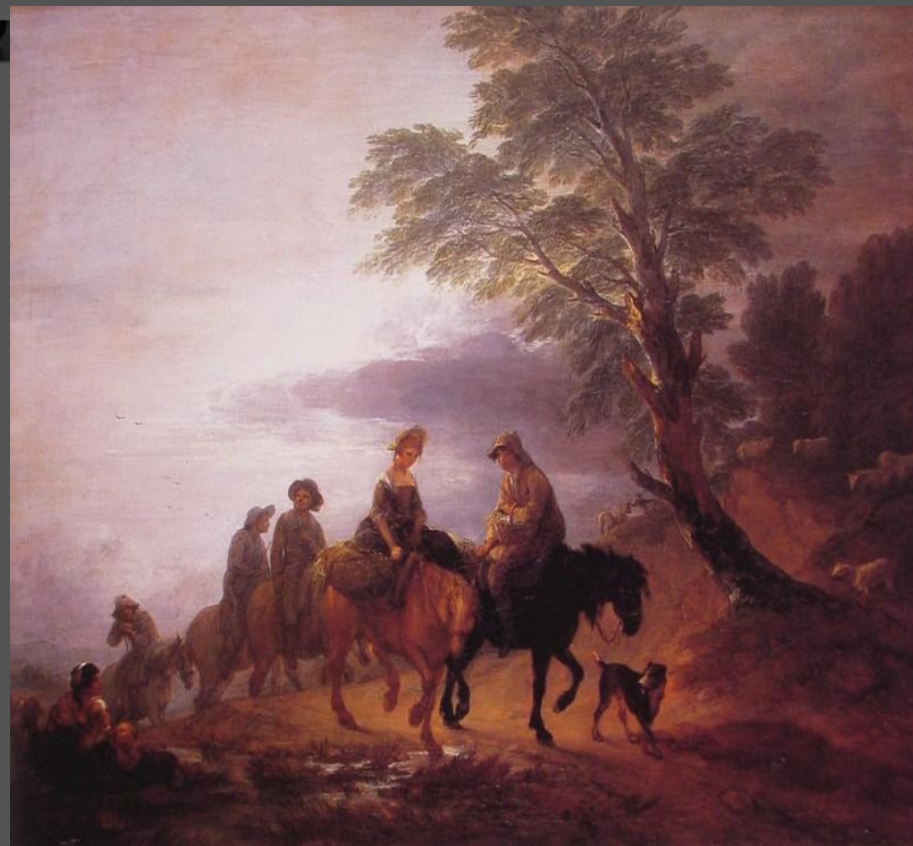
Панорамный пейзаж с крестьянами на лошадях