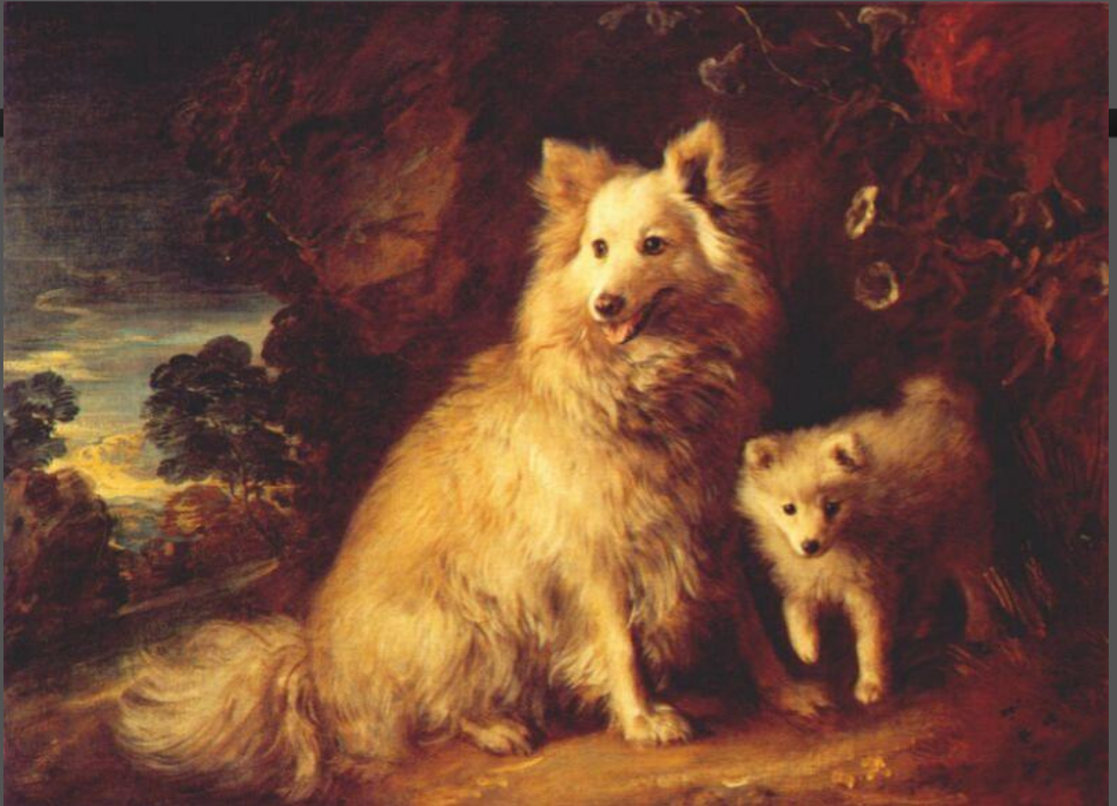
Померанская самка и щенок, ок.1777