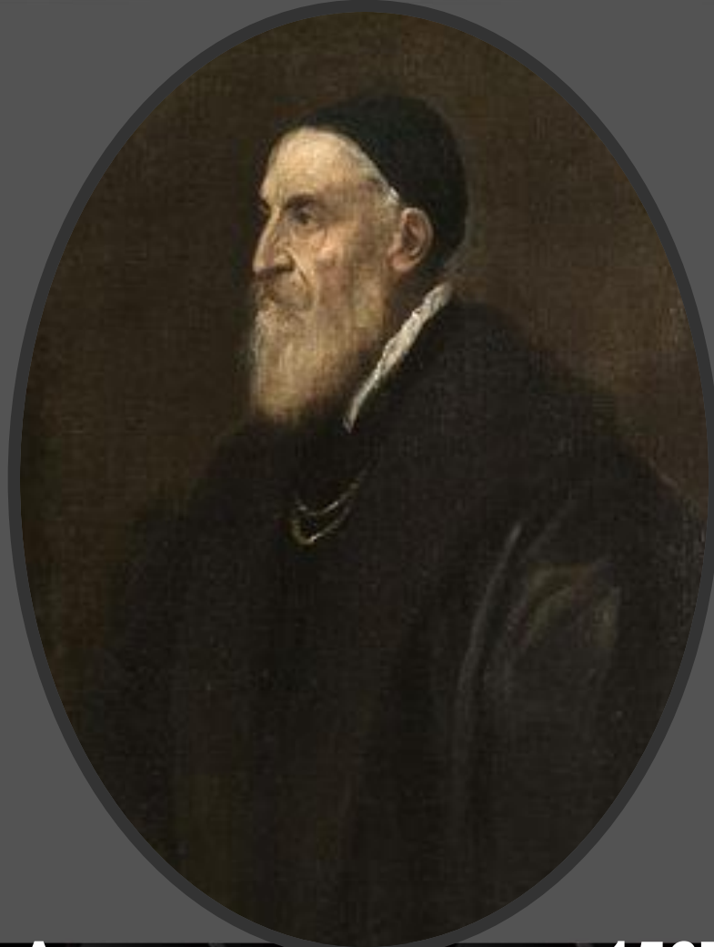
Автопортрет, около 1567