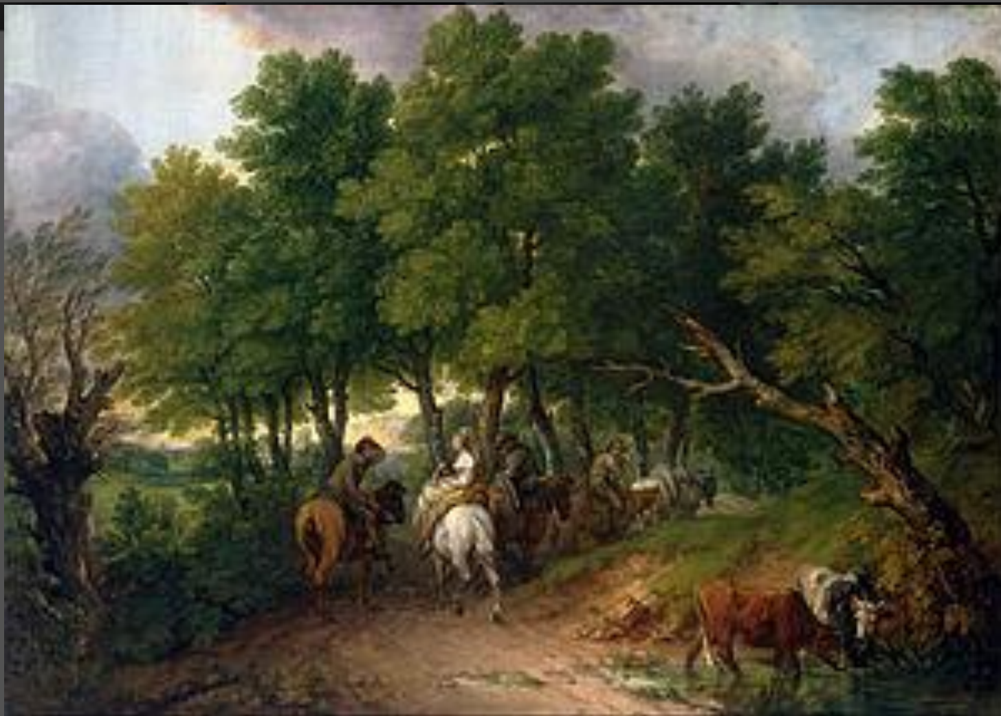
«Возвращение крестьян с рынка» (1767–1768)