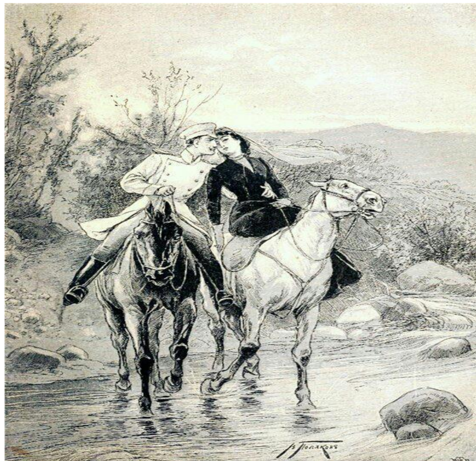
Иллюстрация к роману "Герой нашего времени" - "Княжна Мери"