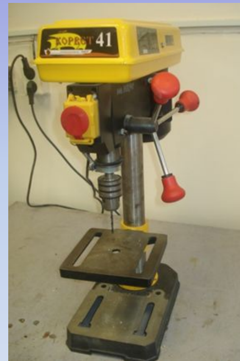
Сверлильн ый станок