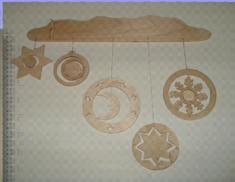
Композиция из снежинок «Снегопад»