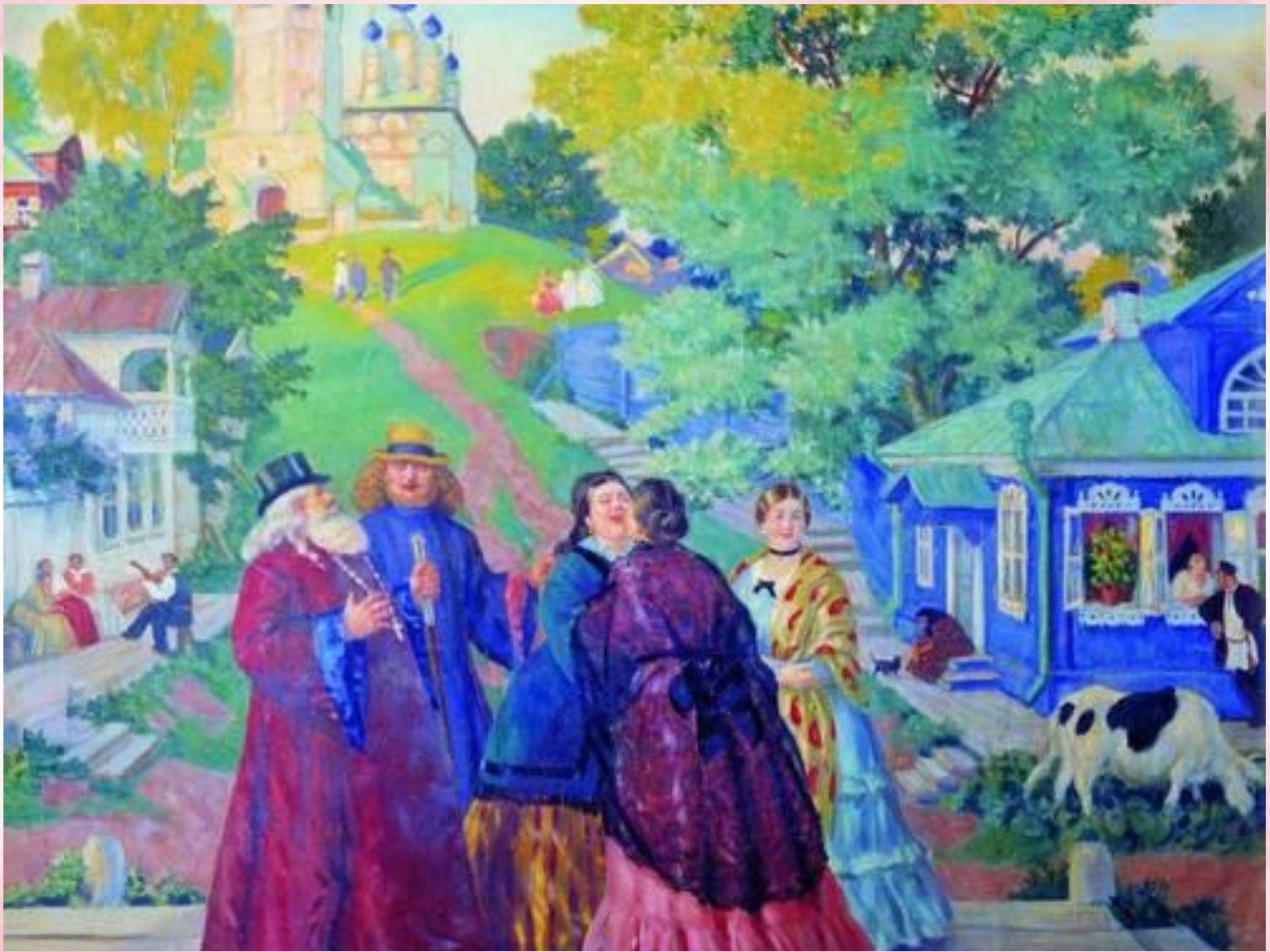
Кустодиев Борис Михайлович. Встреча (Пасхальный день)