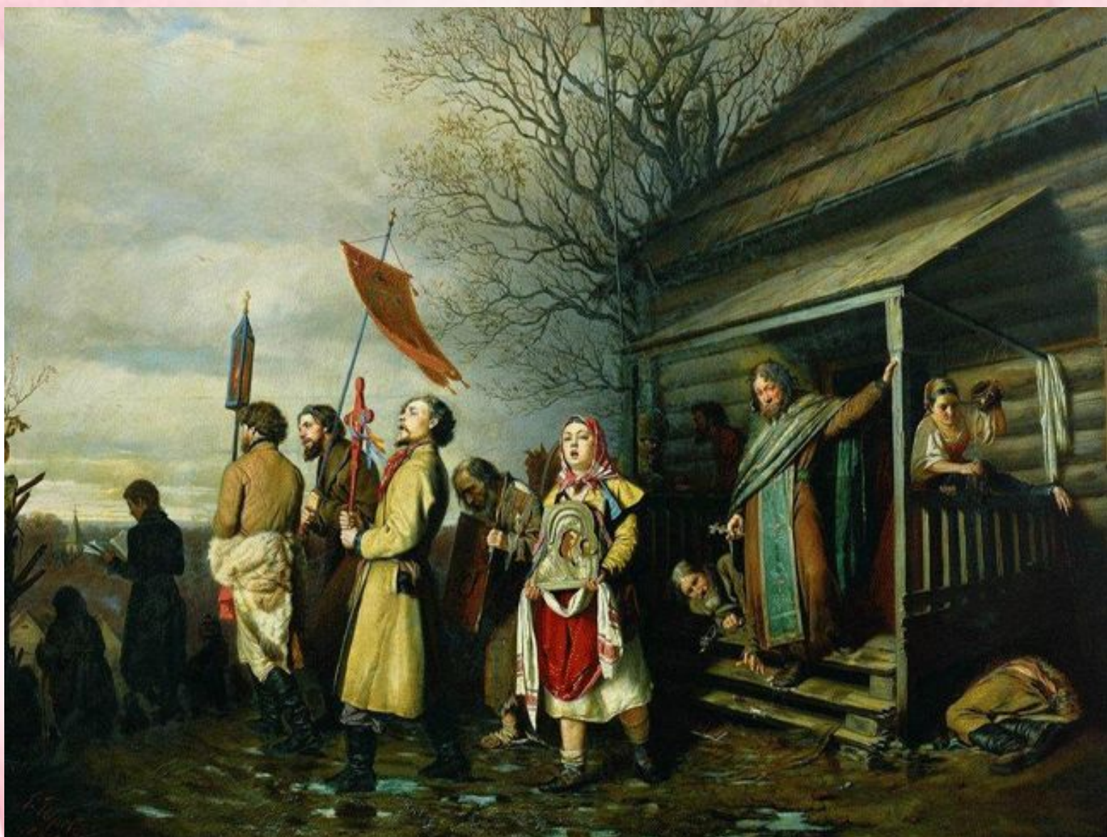
Василий Перов. Сельский крестный ход