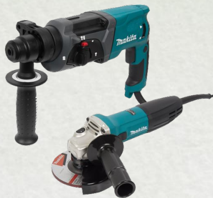
ЛМ 82957418 Набор (перфоратор и ушм) DK0120 Makita