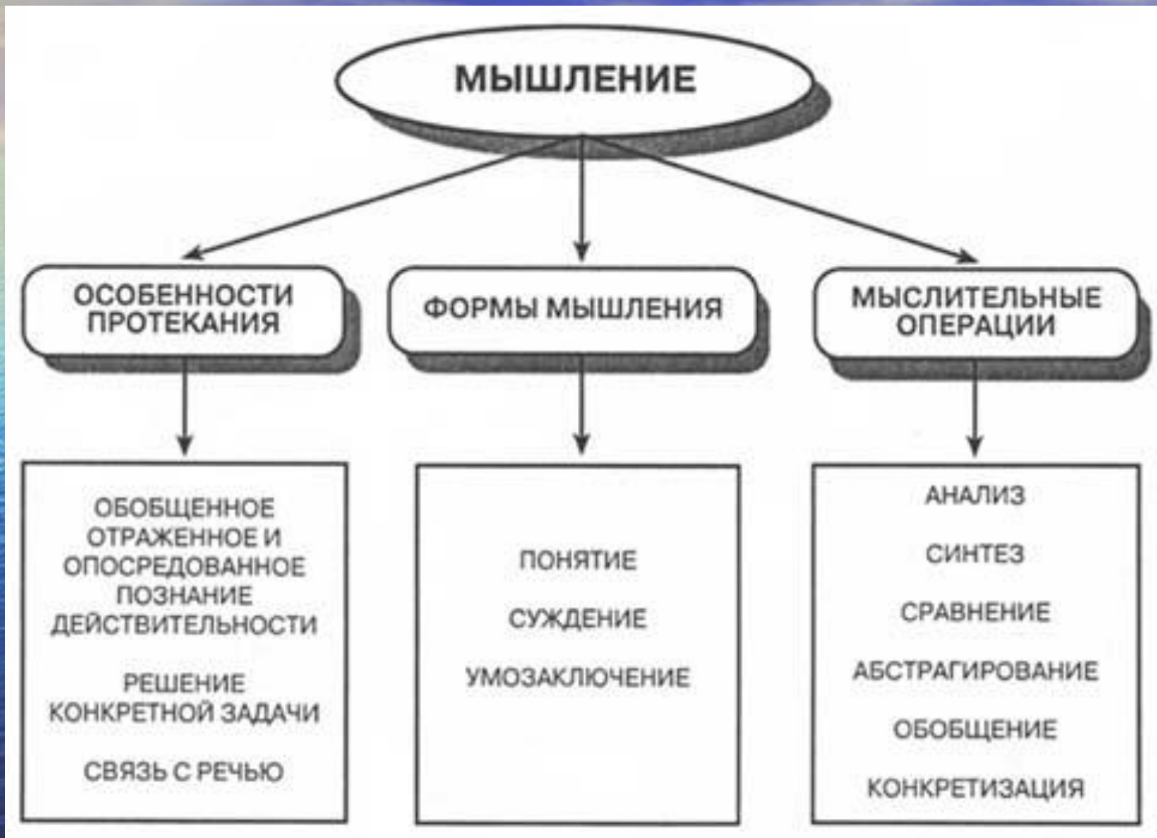
Рис.1. Общая характеристика мышления