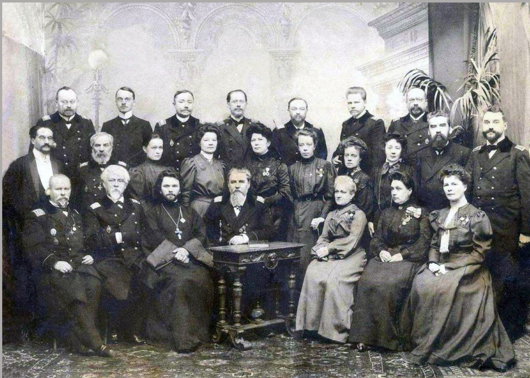
Иркутский институт благородных девиц Учительский коллектив (19 век)