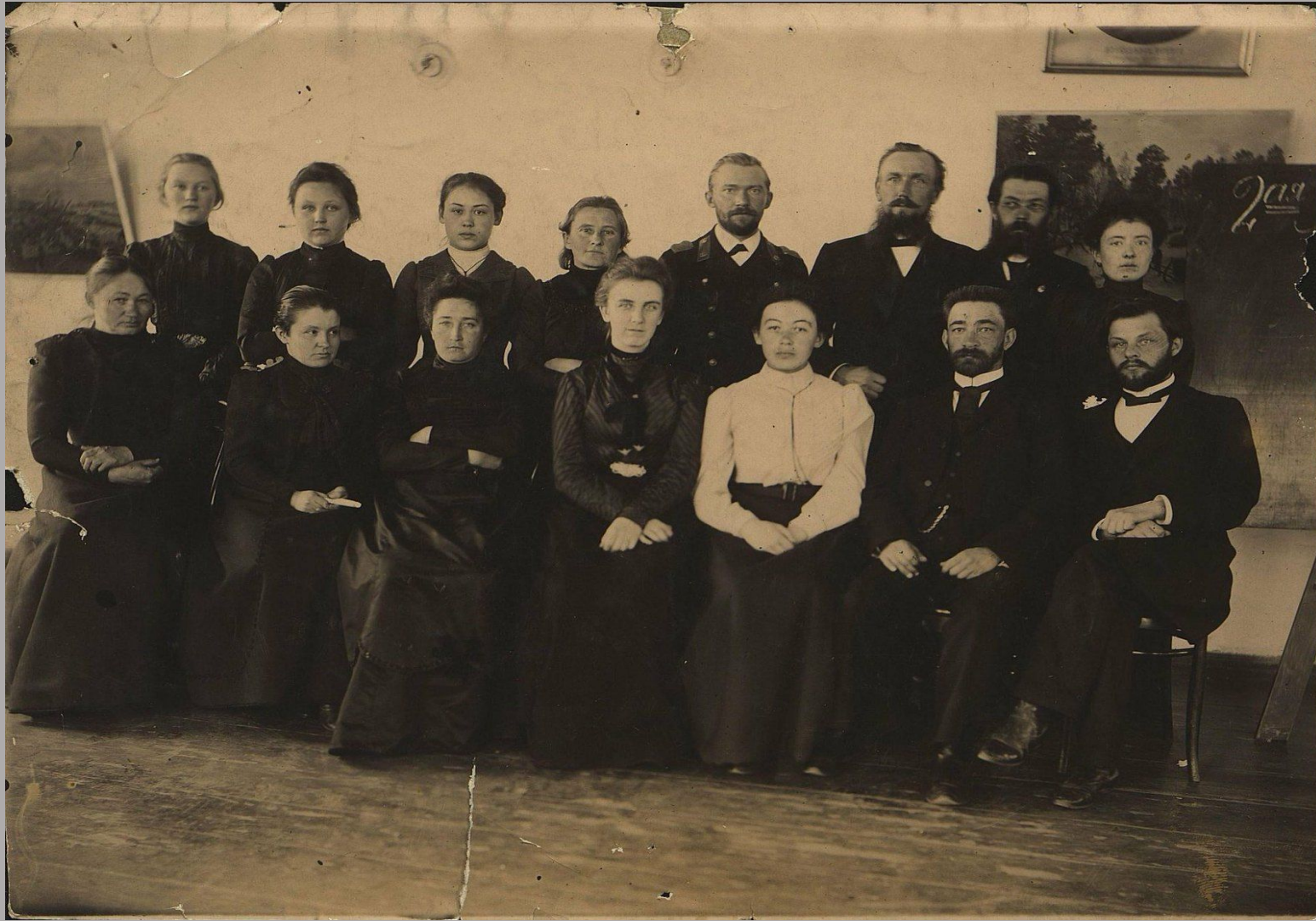
Учителя иркутских школ (начало 20 века)