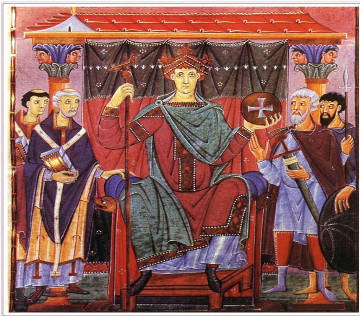
Оттон III. Миниатюра рубежа X–XI вв.