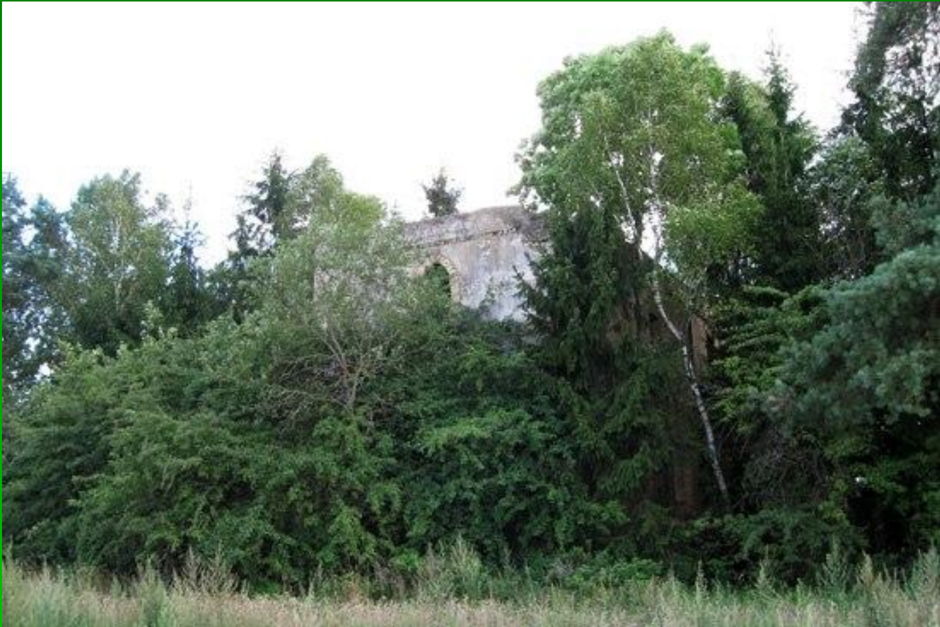
Белы палац у Людзвікова