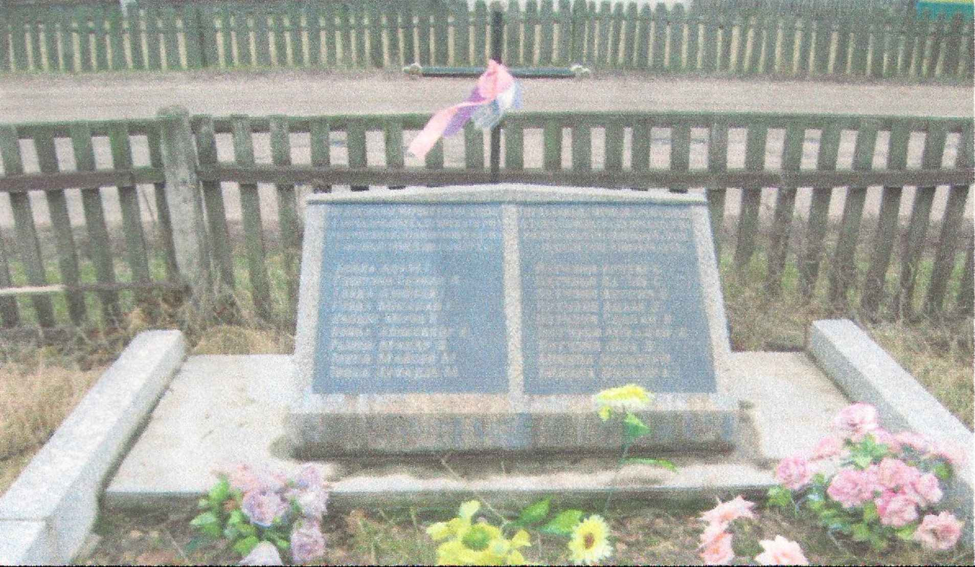
Помнік ахвярам фашызма