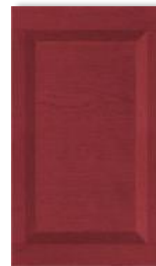
Гиове лайт россо