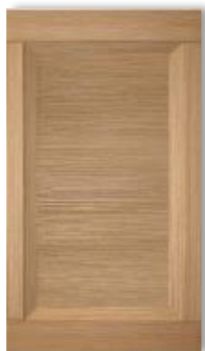
Гиове лайт натурале