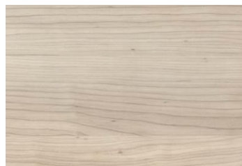
942W frassino bianco