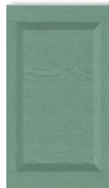
Гиове лайт верде