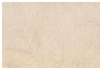
933T costa marino