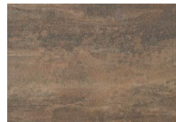
939T strombolly alleanza