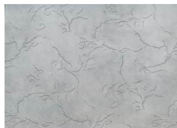
946T valle terra