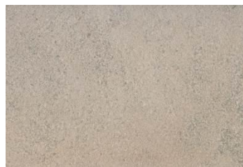
934T fondo marino