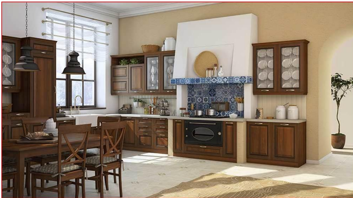
Гарнитур с фасадами «Кристина»