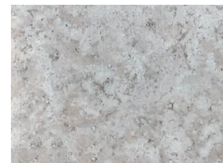
944T misty roccia