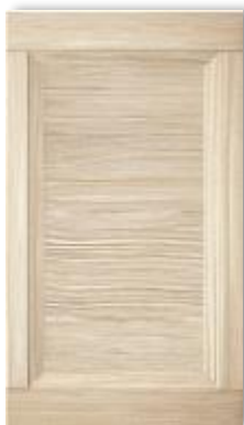
Гиове лайт капучино