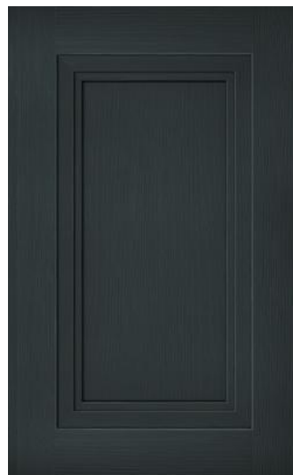
Скале серый жемчуг