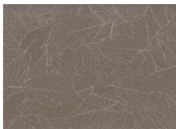
947T flora antiche