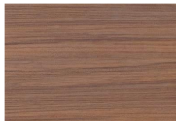
943W foresta di notte