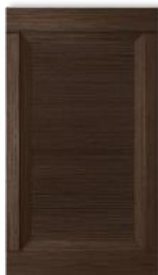
Гиове лайт ноте